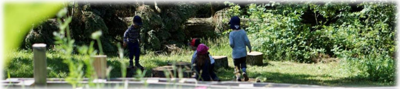
Abbildung 16: co.natur gGmbH Waldkindergarten Heimsheim