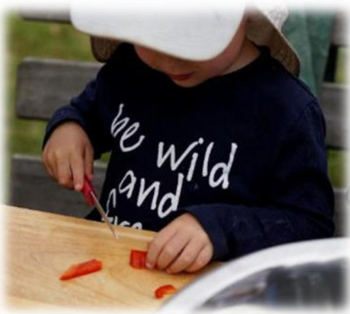
Abbildung 11: co.natur gGmbH Waldkindergarten Heimsheim

In regelmäßigen Abständen bereiten wir am offenen Feuer gemeinsam ein warmes Essen (z.B. Hirsebrei, Suppe, Gemüse-Pfanne, ...) zu. Dieses wird zusammen mit den Kindern aus regionalen, biologischen und saisonalen Produkten frisch gekocht. Auch Gemüse und Obst, welches wir selbst anbauen, sowie Bärlauch wird verarbeitet. In den Sommermonaten müssen wir aufgrund der strengen Vorgaben bezüglich offenem Feuer, auf alternative Kochangebote umsteigen (z.B. Müsli herstellen, Obst oder Gemüsesticks mit Quark).