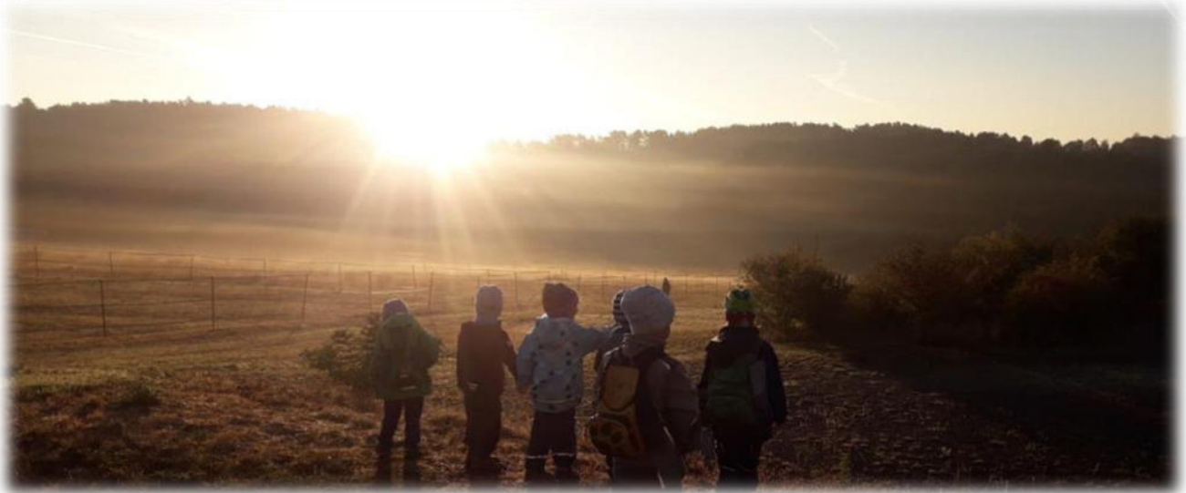
Abbildung 9: co.natur gGmbH Waldkindergarten Heimsheim