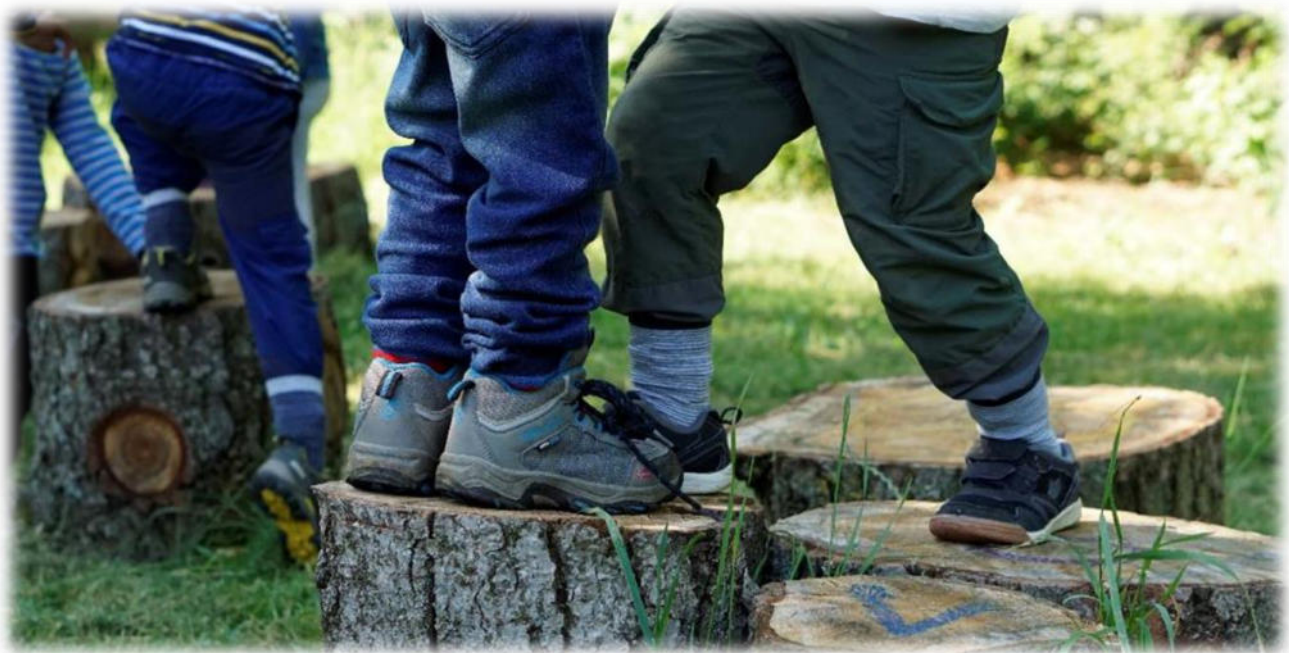
Abbildung 24: co.natur gGmbH Waldkindergarten Heimsheim

Während dem Freispiel wird die Selbständigkeit der Kinder gefördert, denn sie müssen entscheiden, wo, was und mit wem sie spielen wollen. Die Kinder erleben sich als autonom (sie entscheiden selbst, kein Erwachsener entscheidet für sie). Sie können spielerisch die Sprache lernen, sich ausprobieren, neue Spiele kennenlernen und in ihrer eigenen Welt versinken. Außerdem wird die Motorik gefordert und gefördert und die Fantasie angeregt.