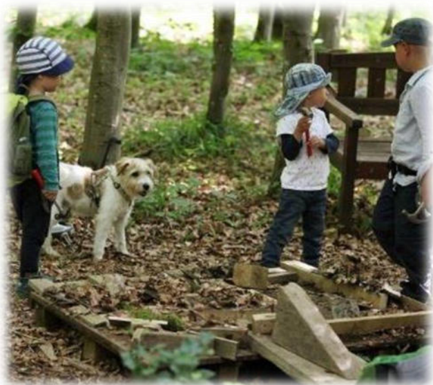
Abbildung 25: co.natur gGmbH Waldkindergarten Heimsheim

Kinder haben einen Willen, dieser Wille soll und darf geäußert werden und wir achten darauf, diesem nach Möglichkeit auch nachzukommen. Alle Kinder haben das Recht ihre Meinung zu sagen und diese wird respektiert.