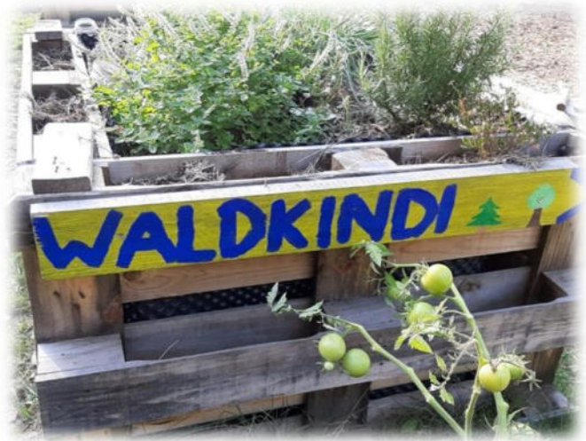
Abbildung 37: co.natur gGmbH Waldkindergarten Weil der Stadt

Kinder äußern ihre Beschwerden oft nicht direkt. Ihre Anliegen und Bedürfnisse, die hinter einer Beschwerde im weitesten Sinne liegen, können sehr unterschiedlich aussehen. Dies kann ein Unwohlsein, eine Unzufriedenheit sein (z. B. mit dem Essen), es kann sich um einen Veränderungswunsch handeln (z. B. bezüglich einer Gruppenregel) oder ein Thema betreffen, das sich aus dem Verhalten und den Reaktionen anderer ergibt (z. B. dem Konflikt, nicht mitspielen zu dürfen). Unsere Mitarbeitenden sind gefordert, die Unmutsbekundungen der Kinder bewusst wahrzunehmen und sich mit ihnen auf die Suche nach dem zu begeben, was hinter der Beschwerde steckt. Deshalb spielen alle Anliegen -auch die, die aus Sicht der Erwachsenen „Kleinigkeiten“ oder „Banales“ darstellen - für uns eine wichtige Rolle. Durch unser Interesse an ihrer Kritik fühlen sich die Kinder ernst genommen und suchen auch bei anderen Sorgen unsere Unterstützung. Die Kinder nutzen im Kindergartenalltag oft informelle Wege, um ihre Unzufriedenheit zu äußern. Sie äußern ihre Beschwerde nicht immer eindeutig und direkt. Dabei müssen sie sicher sein, dass ihre Anliegen ernst genommen werden. Auf die Festlegung einer "Beschwerdestelle" oder eines starren Verfahrens haben wir ganz bewusst verzichtet. Unsere Erfahrung ist, dass sich die Kinder in aller Regel an Mitarbeitende ihres Vertrauens wenden, wenn sie Anliegen haben und sich besprechen wollen.