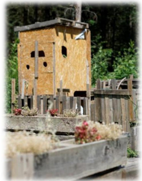
Abbildung 12: co.natur gGmbH Waldkindergarten Heimsheim

Aufgrund der Autarkie bietet es sich bei uns an, das Thema Umwelt- und Naturschutz immer im Alltag zu thematisieren. Es beginnt damit, dass wir Feuer brauchen, damit es uns warm ist und wir kochen und abwaschen können. Wir thematisieren dabei die Kreisläufe in der Natur und wieso die Pflanzen so wichtig für uns sind. Es gibt auch kein fließendes Wasser. Das bedeutet, wir gehen sparsam und effektiv mit dem Wasser um, was wir haben. Wir fangen Regenwasser auf, um die Beete zu gießen. Auch das Wasser vom Händewaschen (mit biolog. Seife) fangen wir auf und gießen damit unsere Obstbäume. Wir erhitzen Wasser, um zu kochen oder Experimente wie z.B. Naturfarben herzustellen. Wir sind uns der Endlichkeit unserer Ressourcen im Alltag bewusst und leben sparsam und nachhaltig. Mindestens einmal im Jahr gibt es ein mehrwöchiges Projekt zum Thema Müll/Entsorgung/Vermeidung/Upcycling.