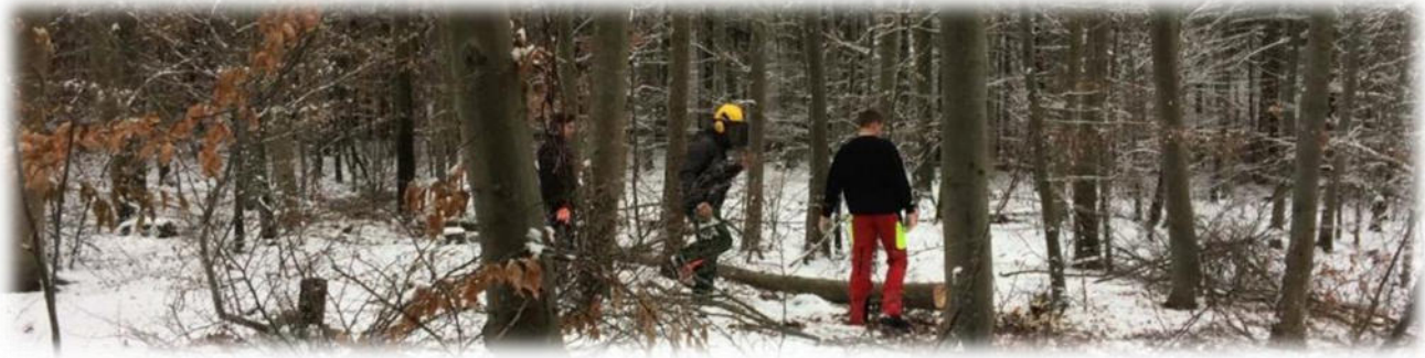
Abbildung 7: co.natur gGmbH Waldkindergarten Heimsheim