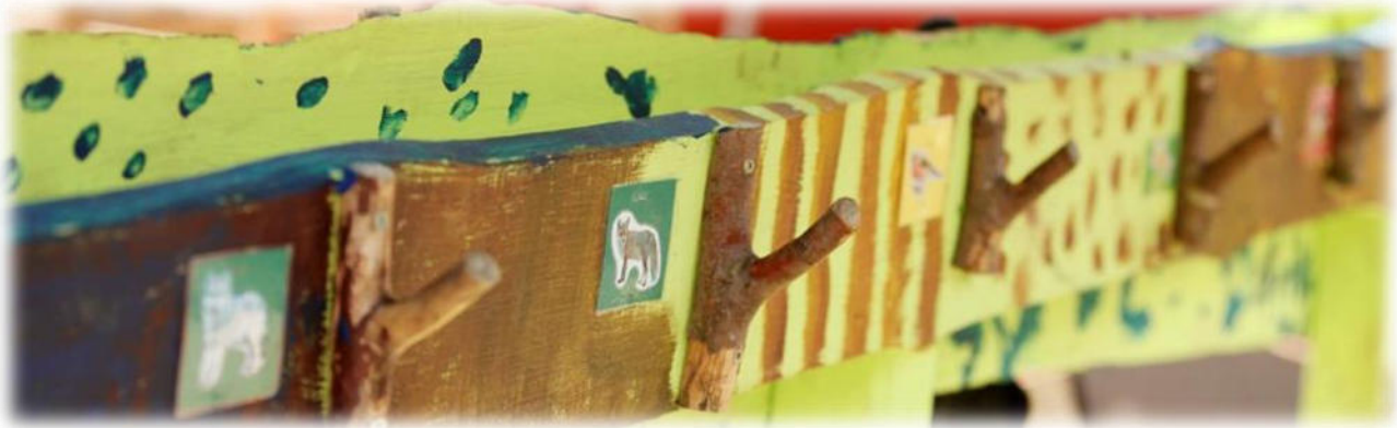
Abbildung 28: co.natur gGmbH Waldkindergarten Heimsheim

Die Eingewöhnung eines neuen Kindes erfolgt in Absprache mit den pädagogischen Fachkräften und ist individuell. Eine Fachkraft übernimmt die Eingewöhnung eines Kindes und geht eine vertrauensvolle Beziehung mit dem Kind ein. Nur ein Kind, das sich sicher und wohlfühlt, kann sich entspannt von den Eltern lösen und sich auf den Kindergarten freuen. Es braucht auch die Bereitschaft der Eltern, sich von ihrem Kind zu lösen, um ihm einen guten Start im Kindergarten zu ermöglichen. Daher legen wir bei der Eingewöhnung auch Wert darauf, dass die Eltern sich wohlfühlen.