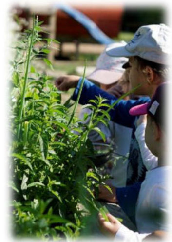
Abbildung 5: co.natur gGmbH Waldkindergarten Heimsheim

Deswegen ist es unerlässlich, dass Kinder wieder die Natur ganz elementar kennenlernen, weil es für den Fortbestand unserer Kultur wichtig ist, dass die Natur geachtet und geschützt wird. Nur wer die Natur in ihrer Einzigartigkeit kennen-gelernt hat, kann zu ihrer Erhaltung beitragen.