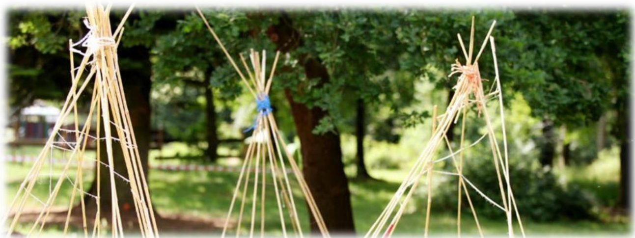
Abbildung 33: co.natur gGmbH Waldkindergarten Heimsheim

Eine vertrauensvolle und intensive Zusammenarbeit zwischen Eltern und pädagogischen Fachkräften ist eine wichtige Voraussetzung dafür, dass die ganzheitliche Förderung der kindlichen Persönlichkeit gelingt. Wir wollen, dass die Eltern ihre Kinder gut aufgehoben wissen und sich aktiv beteiligen. Wir legen Wert auf Mitarbeit und partnerschaftliches Miteinander sowie darauf, die Familie des Kindergartenkindes zu integrieren. Wir machen Veranstaltungen für die ganze Familie. Es gibt Geschwister-Besuchstage und Tage für ehemalige Kindergartenkinder, an denen diese zu Besuch kommen können, um liebgewonnene Erfahrungen und Aktivitäten aufzufrischen. Uns liegt die verlässliche Bindung zwischen Kindern und den pädagogischen Fachkräften sowie der partnerschaftliche Austausch mit den Eltern am Herzen.