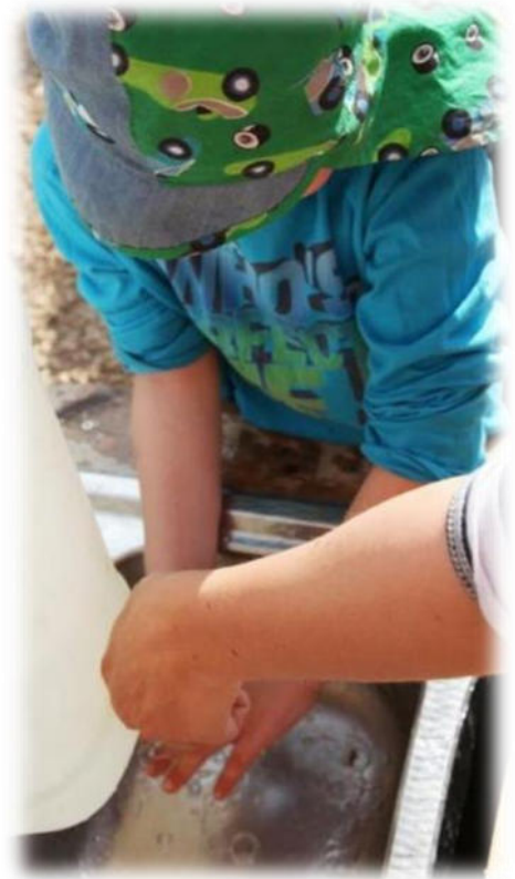
Abbildung 6: co.natur gGmbH Waldkindergarten Heimsheim

Kinder benutzen bei Wanderungen die Waldtoilette. Dazu werden abseits gelegene Plätze ausgewiesen, die regelmäßig wechseln und an denen nicht gespielt wird. Die Fäkalien und das Toilettenpapier werden nach dem „großen Geschäft“ mit dem Spaten vergraben. Der Spaten wird nur für diesen Zweck benutzt und wird in einer Tüte außen am Rucksack befestigt. Das Toilettenpapier wird hiervon getrennt aufbewahrt. Auch bei längeren Frostperioden sind im Wald häufig noch unter Laubresten nicht durchgefrorene Bodenbereiche zu finden. Bei dauergefrorenem Boden können die Exkremente nicht vergraben werden, dann werden Hundekottüten verwendet. Ggf. werden in einem markierten Bereich auch kleine Gruben vor der Dauerfrostperiode ausgegraben, die dann genutzt werden und mit Laub oder Rindenmulch abgedeckt werden. Werden für die "Waldtoilette" Toilettensitze, Töpfchen ohne Boden oder WC-Brillen verwendet, werden diese nach jeder Benutzung mit geeigneten Reinigungsmitteln gereinigt.