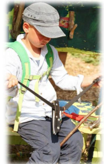
Abbildung 32: co.natur gGmbH Waldkindergarten Heimsheim