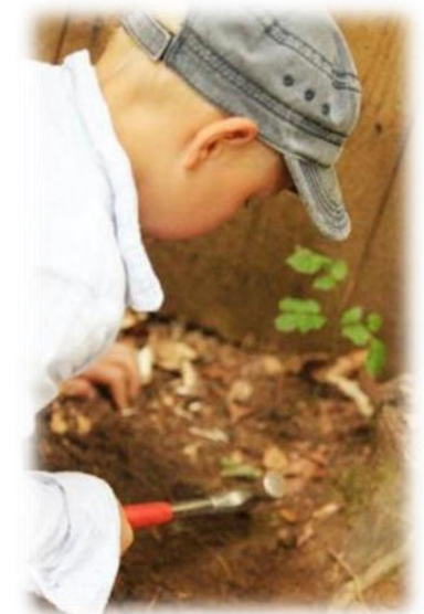
Abbildung 19: co.natur gGmbH Waldkindergarten Heimsheim