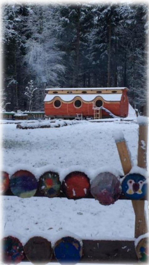
Abbildung 1: co.natur gGmbH Waldkindergarten Heimsheim