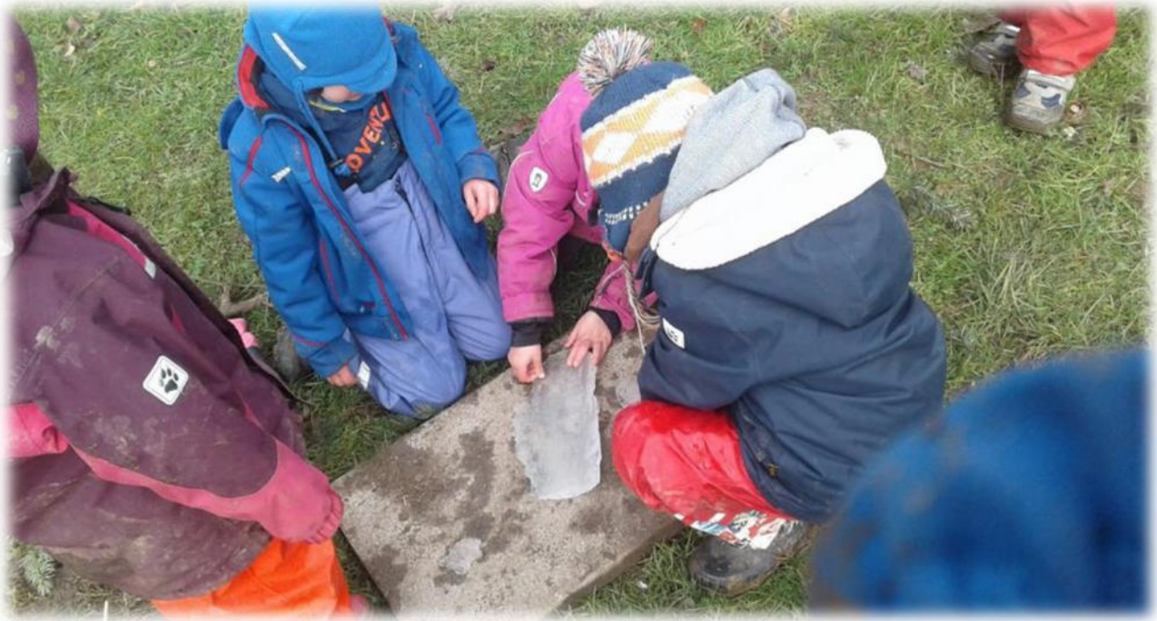
Abbildung 29: co.natur gGmbH Waldkindergarten Heimsheim

Diese Beobachtungsdokumentationen werden im Sozialdatenschutz vertraulich behandelt.