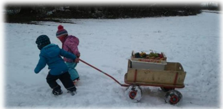
Abbildung 8: co.natur gGmbH Waldkindergarten Heimsheim

Im Winter kann es sehr kalt werden. Dann wird auf warme Kleidung (und zusätzlich Handschuhe und Mütze) geachtet sowie auf Aufwärm- und Bewegungsmöglichkeiten der Kinder, z.B. im Bauwagen. Außerdem ist es empfehlenswert, dass die Kinder warmes Vesper und Tee in Thermobehälter mitbringen.