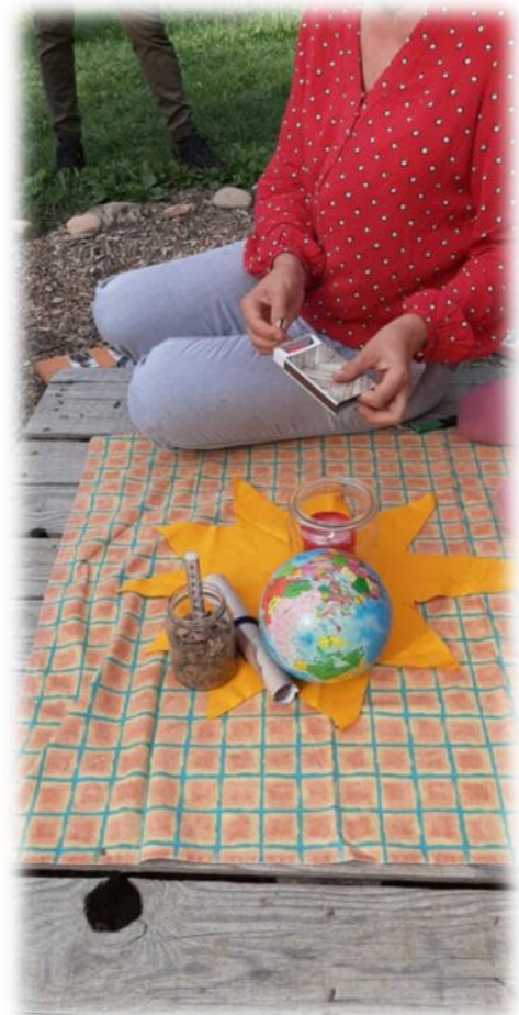
Abbildung 36: co.natur gGmbH Waldkindergarten Heimsheim

Wichtig hierbei ist nur die Art und Weise, diese Fehler zu betrachten, zu bewerten und damit umzugehen. Um einen konstruktiven Umgang mit Fehlern gewährleisten zu können, müssen sie offen benannt, eingestanden und aufgearbeitet werden und können so zur Verbesserung unserer Arbeit führen. Fehlverhalten oder Sachverhalte, deren Sinn und Hintergrund nicht verstanden werden, sprechen unsere Mitarbeitenden offen bei Kollegen und Kolleginnen, im Team und gegenüber Leitungen und Geschäftsleitung an. Es ist uns wichtig, dass unsere Mitarbeitenden auf ihre physischen und psychischen Grenzen achten, gesundheitliche Beeinträchtigungen ernst nehmen und sich bei Bedarf rechtzeitig Hilfe holen.