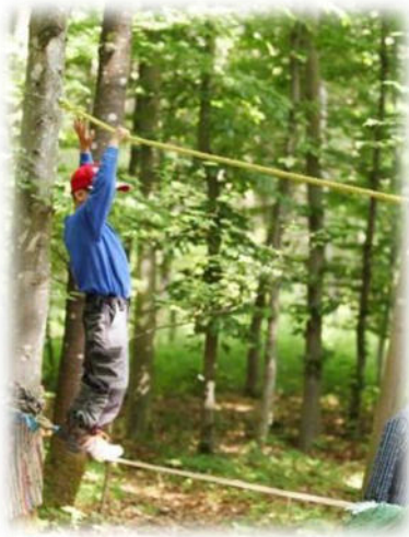
Abbildung 4: co.natur gGmbH Waldkindergarten Heimsheim

Ziel ist es, dass Kinder lernen, sich selbst einzuschätzen und sich etwas zuzutrauen. Die Kinder erfahren, dass sie durch eigene Anstrengung und Motivation Ziele erreichen können und entwickeln eine altersgemäße Frustrationstoleranz, wenn nicht gleich alles auf Anhieb gelingt. Sie lernen, sich zu konzentrieren und entwickeln Ausdauer. Die Kinder erleben Freude und Spaß.