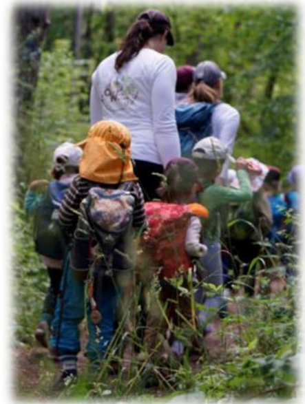
Abbildung 35: co.natur gGmbH Waldkindergarten Heimsheim

Unsere Mitarbeitenden nehmen aktiv Stellung gegen diskriminierendes, gewalttätiges und sexistisches Verhalten und greifen in solchen Fällen auch sofort ein. Wenn die Mitarbeitenden Kenntnis von einem Sachverhalt erhalten, der die Vermutung auf ein Fehlverhalten durch einen Mitarbeitenden nahelegt, wird dies umgehend dem unmittelbaren Vorgesetzten als auch der Geschäftsführung mitgeteilt. Das pädagogische Handeln unserer Mitarbeitenden ist transparent und nachvollziehbar und entspricht fachlichen Standards. Es werden vorhandene Strukturen und Abläufe eingehalten und dokumentiert. Dabei wird sich nach den Bedürfnissen der Kinder gerichtet und mit den Eltern bzw. Sorgeberechtigten kollegial und transparent zusammengearbeitet.