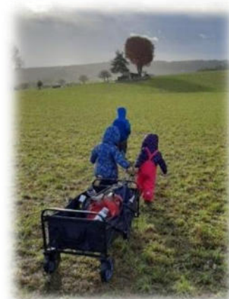
Abbildung 10: co.natur gGmbH Waldkindergarten Heimsheim

Um 8.30 Uhr beginnt der Begrüßungskreis. Hier werden Begrüßungslieder gesungen, die anwesenden Kinder und Betreuungspersonen gezählt und gemeinsam überlegt, welche Kinder fehlen. Dann geht die Gruppe auf Expedition in den Wald. Ggf. kann es auch Aktionen am Bauwagenplatz geben, wie z.B. Vorschule, Essenszubereitung oder Freispiel. Zwischen 12.30 Uhr und 13.30 Uhr können die Kinder am Bauwagen abgeholt werden. Die Betreuungspersonen haben dann auch Zeit für Tür- und Angelgespräche.