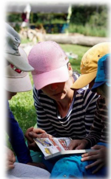
Abbildung 13: co.natur gGmbH Waldkindergarten Heimsheim

Wir unterliegen, wie alle Kindertageseinrichtungen, den Bestimmungen des KVJS. Jeder Kindergarten wird von einer Einrichtungsleitung geführt. Diese übernehmen die Personalführung und die Einsatzplanung des Personals. Es sind jeden Tag, während der gesamten Öffnungszeit, mindestens 2 Personen zeitgleich vor Ort (wovon mindestens eine davon eine Fachkraft ist). In der Kernzeit von 8.30 Uhr bis 12.30 Uhr sind mindestens 3 Mitarbeitende zeitgleich im Wald eingesetzt, wovon mindestens einer davon eine Fachkraft ist. Im Rahmen der finanziellen und organisatorischen Möglichkeiten sichern wir die regelmäßige Anwesenheit von 3 - 5 Personen. Vertretungen aufgrund von Krankheit, Fortbildung, etc. werden durch die Flexibilität von Teilzeit-Angestellten und durch ehrenamtliche Mithilfe von Eltern sichergestellt.