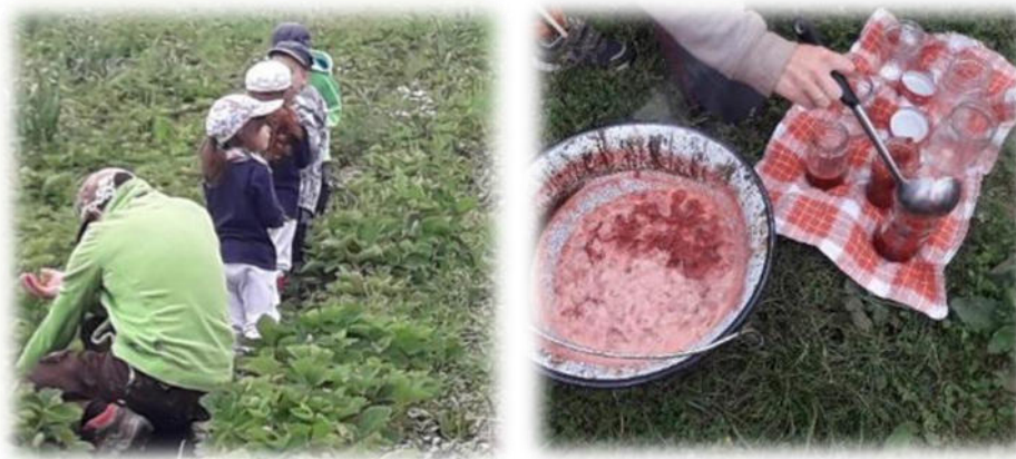
Abbildung 21: co.natur gGmbH Waldkindergarten Heimsheim

Arbeitsprozesse werden nach Möglichkeit in den Außenbereich verlagert, sodass ein ausgewogenes Verhältnis zwischen Tätigkeiten im Innen- und Außenbereich besteht. [...] Dieser Anspruch wird von den Waldkindergärten weitestgehend realisiert. Objekt- und kulturgebundene Innenraumtätigkeiten lernt das Waldkindergartenkind ohnehin in der verbleibenden Familienzeit kennen [...] Auf Lob wird weitestgehend verzichtet. [...]