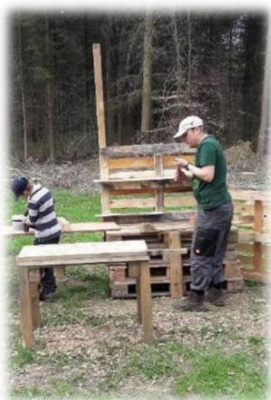
Abbildung 34: co.natur gGmbH Waldkindergarten Heimsheim

Nur mit der aktiven Mitarbeit von Eltern ist es möglich, den Waldkindergarten aufrechtzuerhalten. Eltern sind aber auch Vorbild und leben einen Gemeinschaftssinn vor. Die aktive Mitarbeit von Eltern ist wichtig für die Öffentlichkeitsarbeit, spart Geld für Neuanschaffungen, sorgt für ein Gefühl der Gemeinschaft und macht zudem noch Spaß.