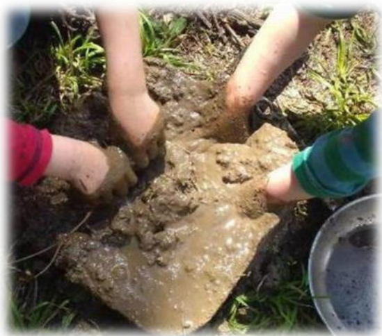
Abbildung 20: co.natur gGmbH Waldkindergarten Heimsheim

Wenn wir unsere Kinder ernst nehmen, dann sollten wir sie an der realen, ernsthaften Lebenswirklichkeit teilhaben lassen. Und da sind es vor allem die alltagstauglichen Fertigkeiten, die zählen: Arbeiten, die Tag für Tag in der Lebensgemeinschaft Familie oder in einer Kindertageseinrichtung anfallen, die getan werden müssen, um die Versorgung dieser Gemeinschaft zu gewährleisten. Dabei eröffnet sich ein Betätigungsfeld, das weit über die Nahrungszubereitung hinausgeht.