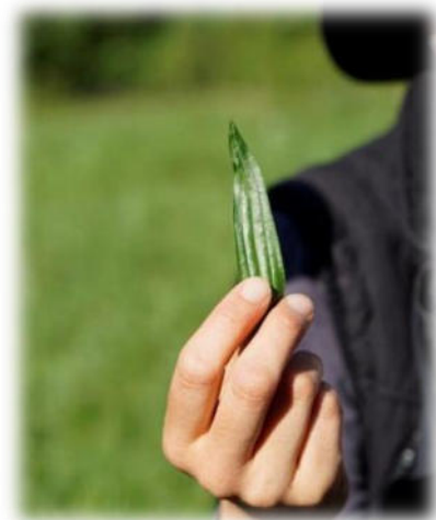
Abbildung 23: co.natur gGmbH Waldkindergarten Heimsheim

„Alles zu seiner Zeit“? Ja, bitte! Was wollen Eltern einem Schulkind noch bieten, das durch eben solche Vorwegnahmen nur desinteressiert antworten kann: „Alter Hut, das kenn' ich schon!“ Auf der Strecke bleibt das Wissen und die Beheimatung stiftende Kenntnis des näheren Wohnumfeldes und deren Flora und Fauna mit der Chance, hier lebenspraktisch tätig werden zu können. Ich habe als Kind im Sommer Kamille sammeln dürfen bzw. müssen. Ohne dass das Beutelchen voll war, brauchte ich nicht heimzukommen. Ich wusste um die Sinnhaftigkeit, Notwendigkeit meines Tuns. Ich war eingebunden in nützliche, weil notwendige Tätigkeitsabläufe. Viele standen im Zusammenhang mit einer bestimmten Jahreszeit. Die Natur gab ein Zeitfenster vor, das genutzt werden musste. Und die Eltern hielten mich dazu an. Und so ganz nebenbei lernte ich die Namen von Pflanzen - hier Heilkräutern - und deren wohltuende Wirkung auf den menschlichen Organismus.