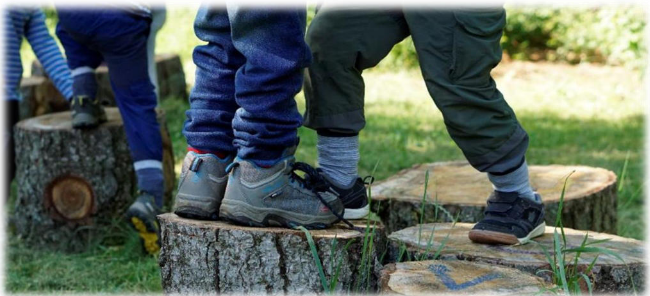
Abbildung 24: co.natur gGmbH Waldkindergarten Heimsheim

Während dem Freispiel wird die Selbständigkeit der Kinder gefördert, denn sie müssen entscheiden, wo, was und mit wem sie spielen wollen. Die Kinder erleben sich als autonom (sie entscheiden selbst, kein Erwachsener entscheidet für sie). Sie können spielerisch die Sprache lernen, sich ausprobieren, neue Spiele kennenlernen und in ihrer eigenen Welt versinken. Außerdem wird die Motorik gefordert und gefördert und die Fantasie angeregt.