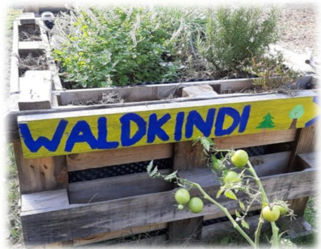
Abbildung 37: co.natur gGmbH Waldkindergarten Weil der Stadt

Kinder äußern ihre Beschwerden oft nicht direkt. Ihre Anliegen und Bedürfnisse, die hinter einer Beschwerde im weitesten Sinne liegen, können sehr unterschiedlich aussehen. Dies kann ein Unwohlsein, eine Unzufriedenheit sein (z. B. mit dem Essen), es kann sich um einen Veränderungswunsch handeln (z. B. bezüglich einer Gruppenregel) oder ein Thema betreffen, das sich aus dem Verhalten und den Reaktionen anderer ergibt (z. B. dem Konflikt, nicht mitspielen zu dürfen). Unsere Mitarbeitenden sind gefordert, die Unmutsbekundungen der Kinder bewusst wahrzunehmen und sich mit ihnen auf die Suche nach dem zu begeben, was hinter der Beschwerde steckt. Deshalb spielen alle Anliegen -auch die, die aus Sicht der Erwachsenen „Kleinigkeiten“ oder „Banales“ darstellen - für uns eine wichtige Rolle. Durch unser Interesse an ihrer Kritik fühlen sich die Kinder ernst genommen und suchen auch bei anderen Sorgen unsere Unterstützung. Die Kinder nutzen im Kindergartenalltag oft informelle Wege, um ihre Unzufriedenheit zu äußern. Sie äußern ihre Beschwerde nicht immer eindeutig und direkt. Dabei müssen sie sicher sein, dass ihre Anliegen ernst genommen werden. Auf die Festlegung einer "Beschwerdestelle" oder eines starren Verfahrens haben wir ganz bewusst verzichtet. Unsere Erfahrung ist, dass sich die Kinder in aller Regel an Mitarbeitende ihres Vertrauens wenden, wenn sie Anliegen haben und sich besprechen wollen.