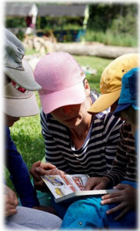
Abbildung 13: co.natur gGmbH Waldkindergarten Heimsheim

Das geplante pädagogische Personal setzt sich aus 3-4 Fachkräften, in Voll- oder Teilzeit mit unterschiedlichen Qualifikationen zusammen. Wir stellen also ein vielfältiges Team, in das sich jeder durch verschiedene Alters- und Lebenserfahrungen einbringen kann.