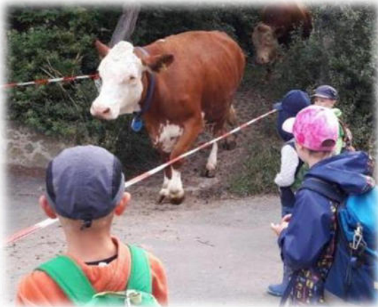
Abbildung 22: co.natur gGmbH Waldkindergarten Heimsheim

Im Kindergarten und in Familien mit zwei und mehr Kindern sind die Voraussetzungen gut. Kinder, die Wissen weitergeben, profitieren u.a. sprachlich und entlasten Erwachsene. Es müssen nicht immer die älteren Kinder sein, die als Wissensvermittler agieren. Kompetenz ist das entscheidende Qualifikationsmerkmal, verbunden mit der Fähigkeit, das Erlernte anschaulich und in logischer Folge zu präsentieren.