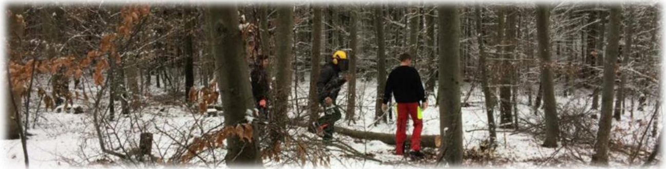
Abbildung 7: co.natur gGmbH Waldkindergarten Heimsheim

Das Wetter kann immer wieder zu einer Gefahr werden. Allgemein ist es immer wichtig, dem Wetter entsprechend gekleidet zu sein. Regenkleidung und Wechselkleidung ist immer vorhanden.