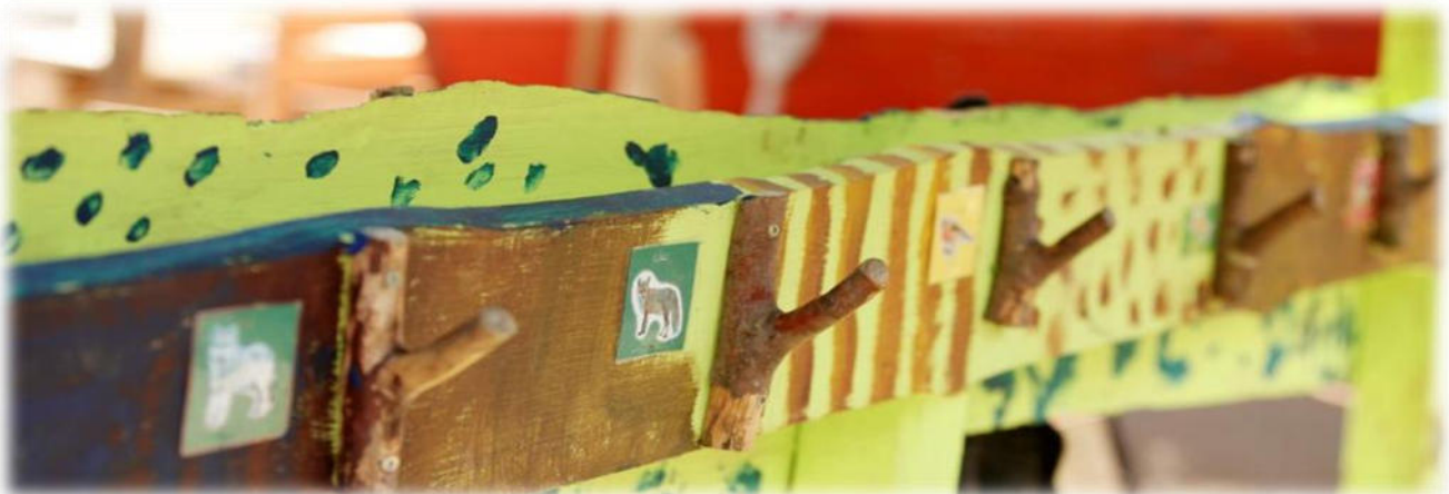
Abbildung 28: co.natur gGmbH Waldkindergarten Heimsheim

Die Eingewöhnung eines neuen Kindes erfolgt in Absprache mit den pädagogischen Fachkräften und ist individuell. Eine Fachkraft übernimmt die Eingewöhnung eines Kindes und geht eine vertrauensvolle Beziehung mit dem Kind ein. Nur ein Kind, das sich sicher und wohlfühlt, kann sich entspannt von den Eltern lösen und sich auf den Kindergarten freuen. Es braucht auch die Bereitschaft der Eltern, sich von ihrem Kind zu lösen, um ihm einen guten Start im Kindergarten zu ermöglichen. Daher legen wir bei der Eingewöhnung auch Wert darauf, dass die Eltern sich wohlfühlen.