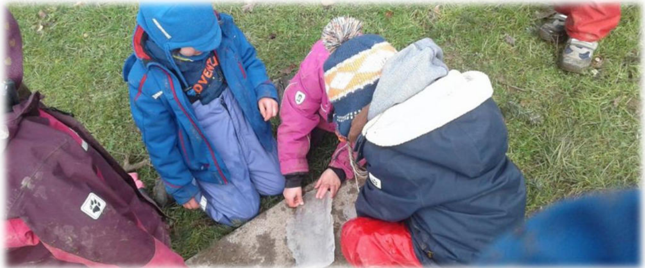
Abbildung 29: co.natur gGmbH Waldkindergarten Heimsheim

Diese Beobachtungsdokumentationen werden im Sozialdatenschutz vertraulich behandelt.