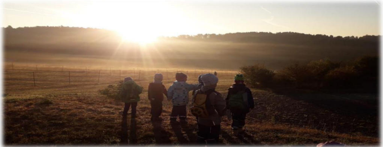
Abbildung 9: co.natur gGmbH Waldkindergarten Heimsheim