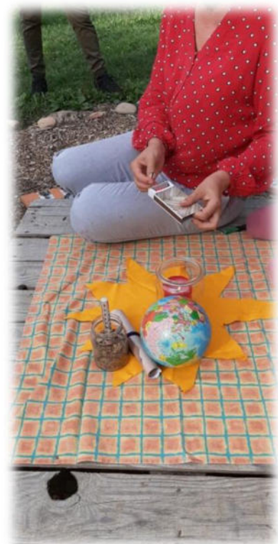
Abbildung 36: co.natur gGmbH Waldkindergarten Heimsheim

Wichtig hierbei ist nur die Art und Weise, diese Fehler zu betrachten, zu bewerten und damit umzugehen. Um einen konstruktiven Umgang mit Fehlern gewährleisten zu können, müssen sie offen benannt, eingestanden und aufgearbeitet werden und können so zur Verbesserung unserer Arbeit führen. Fehlverhalten oder Sachverhalte, deren Sinn und Hintergrund nicht verstanden werden, sprechen unsere Mitarbeitenden offen bei Kollegen und Kolleginnen, im Team und gegenüber Leitungen und Geschäftsleitung an. Es ist uns wichtig, dass unsere Mitarbeitenden auf ihre physischen und psychischen Grenzen achten, gesundheitliche Beeinträchtigungen ernst nehmen und sich bei Bedarf rechtzeitig Hilfe holen.