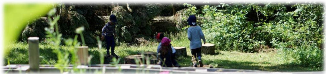
Abbildung 16: co.natur gGmbH Waldkindergarten Heimsheim

Wir achten auf eine wertschätzende Haltung und Sprache und fördern das aktive Zuhören. Wir sind soziale Vorbilder und leben den Kindern Mitgefühl („Ich fühle mit dir“) und Empathie („Ich verstehe dich“) vor.