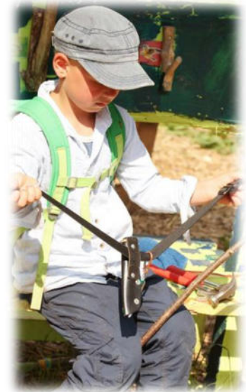
Abbildung 32: co.natur gGmbH Waldkindergarten Heimsheim