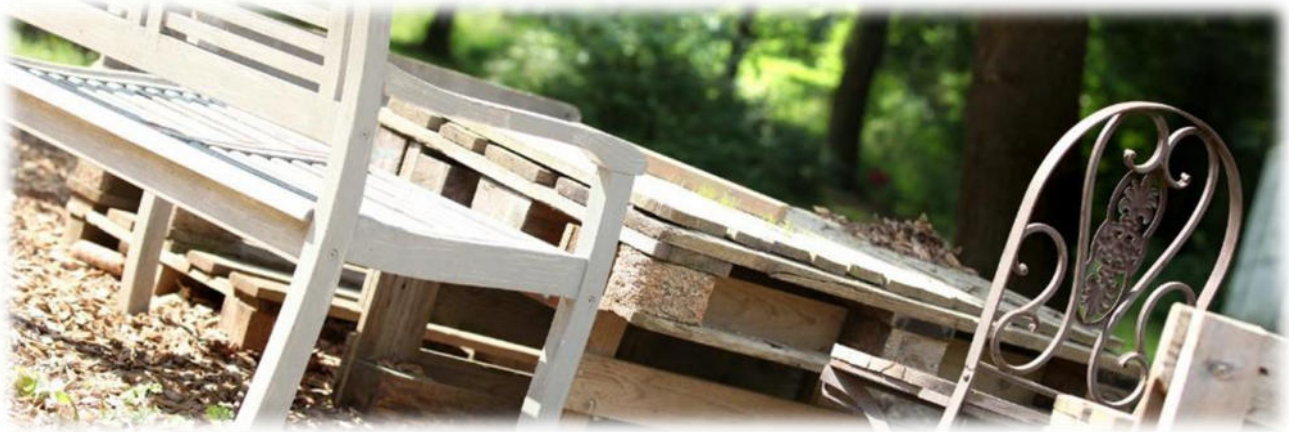
Abbildung 14: co.natur gGmbH Waldkindergarten Heimsheim

Außerdem bekommen alle Mitarbeitenden eine Brandschutzunterweisung.