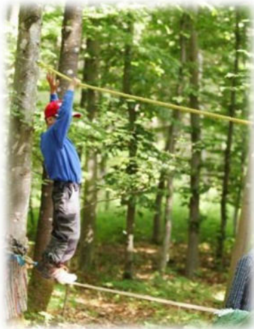
Abbildung 4: co.natur gGmbH Waldkindergarten Heimsheim

Ziel ist es, dass Kinder lernen, sich selbst einzuschätzen und sich etwas zuzutrauen. Die Kinder erfahren, dass sie durch eigene Anstrengung und Motivation Ziele erreichen können und entwickeln eine altersgemäße Frustrationstoleranz, wenn nicht gleich alles auf Anhieb gelingt. Sie lernen, sich zu konzentrieren und entwickeln Ausdauer. Die Kinder erleben Freude und Spaß.