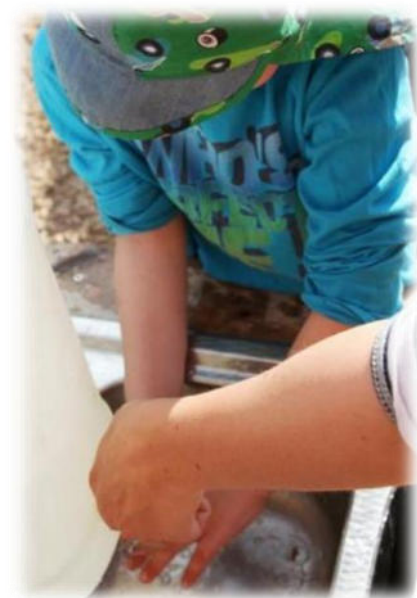
Abbildung 6: co.natur gGmbH Waldkindergarten Heimsheim

Nach jedem Toilettengang und vor dem Essen ist eine gründliche Reinigung der Hände mit Wasser und Seife notwendig. Die Kinder reinigen die Hände mit mitgebrachtem Wasser (Trinkwasserqualität) und pH-neutraler, abbaubarer Flüssigseife (die Bodenbelastung durch die Flüssigseife ist vernachlässigbar). Pro Person haben wir eine Wassermenge von ca. 500 ml dabei. Der Wasserkanister wird täglich neu mit Trinkwasser befüllt. 2 Kanister werden immer abwechselnd benutzt, um ein zwischenzeitliches komplettes Trocknen zu gewährleisten und damit der Biofilmbildung vorzubeugen. Der Kanister steht im Schatten und damit tagsüber vor direkter Sonneneinstrahlung geschützt, um eine Keimvermehrung zu verhindern. Am Ende des Arbeitstages wird der Kanister vollständig zu entleert und getrocknet. Der Kanister ist für Lebensmittel geeignet und im Winter ist er durch einen Thermobehälter gegen Frost geschützt. Das Wasser aus diesem Kanister wird nur für die Händehygiene verwendet. Zur Händetrocknung hat jedes Kind ein eigenes Stoffhandtuch dabei, das täglich gewechselt wird.