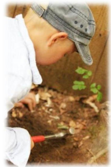
Abbildung 19: co.natur gGmbH Waldkindergarten Heimsheim

Wir trauen den Kindern viel praktisches und motorisches Geschick zu und begegnen ihnen auf Augenhöhe. Im Waldkindergarten werden die Kinder auch ein Stück von der Natur erzogen. Die Natur bewertet nicht, sondern zeigt ganz natürliche Grenzen und Konsequenzen ohne Be- oder Verurteilung. Wir legen viel Wert auf sinnvolle und gemeinschaftliche Arbeit, auf Expeditionen durch den Wald und auf freies Spiel. Die Merkmale des lebenspraktischen Ansatzes sind, dass die Kinder erleben, gebraucht zu werden. Es soll ein gesunder Ausgleich zwischen Kollektiv- und Individualsinn und zwischen praktischem Tun und völlig freiem Spiel sein.