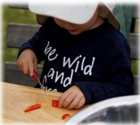
Abbildung 11: co.natur gGmbH Waldkindergarten Heimsheim

Immer wieder bereiten wir am offenen Feuer gemeinsam ein warmes Essen (z.B. Hirsebrei, Suppe, Gemüse-Pfanne, ...) zu. Dieses wird zusammen mit den Kindern aus regionalen, biologischen und saisonalen Produkten frisch gekocht. Auch Gemüse und Obst, welches wir selbst anbauen, wird verarbeitet. An allen-Tagen bringen die Kinder ihr eigenes Essen von zuhause mit. Da keine Kühlmöglichkeiten im Wald vorhanden sind, ist besonders im Sommer darauf zu achten, dass KEINE leicht verderblichen Lebensmittel als Vesper mitgegeben werden.