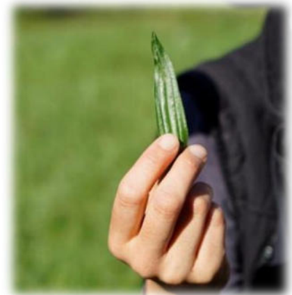
Abbildung 23: co.natur gGmbH Waldkindergarten Heimsheim

„Alles zu seiner Zeit“? Ja, bitte! Was wollen Eltern einem Schulkind noch bieten, das durch eben solche Vorwegnahmen nur desinteressiert antworten kann: „Alter Hut, das kenn' ich schon!“ Auf der Strecke bleibt das Wissen und die Beheimatung stiftende Kenntnis des näheren Wohnumfeldes und deren Flora und Fauna mit der Chance, hier lebenspraktisch tätig werden zu können. Ich habe als Kind im Sommer Kamille sammeln dürfen bzw. müssen. Ohne dass das Beutelchen voll war, brauchte ich nicht heimzukommen. Ich wusste um die Sinnhaftigkeit, Notwendigkeit meines Tuns. Ich war eingebunden in nützliche, weil notwendige Tätigkeitsabläufe. Viele standen im Zusammenhang mit einer bestimmten Jahreszeit.