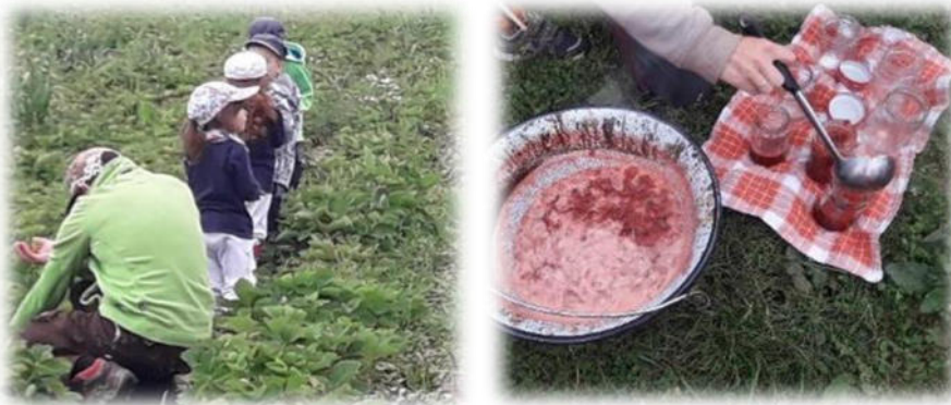
Abbildung 21: co.natur gGmbH Waldkindergarten Heimsheim

Arbeitsprozesse werden nach Möglichkeit in den Außenbereich verlagert, sodass ein ausgewogenes Verhältnis zwischen Tätigkeiten im Innen- und Außenbereich besteht. [...] Dieser Anspruch wird von den Waldkindergärten weitestgehend realisiert. Objekt- und kulturgebundene Innenraumtätigkeiten lernt das Waldkindergartenkind ohnehin in der verbleibenden Familienzeit kennen [...] Auf Lob wird weitestgehend verzichtet. [...]