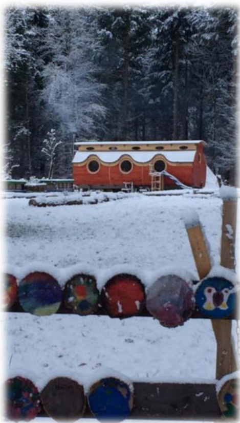
Abbildung 1: co.natur gGmbH Waldkindergarten Heimsheim