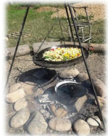
Abbildung 18: co.natur gGmbH Waldkindergarten Heimsheim