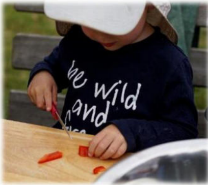
Abbildung 11: co.natur gGmbH Waldkindergarten Heimsheim

In regelmäßigen Abständen bereiten wir (am offenen Feuer) gemeinsam ein warmes Essen (z.B. Hirsebrei, Suppe, Gemüse-Pfanne, Obstquark...) zu. Dieses wird zusammen mit den Kindern aus regionalen, biologischen und saisonalen Produkten frisch gekocht. Auch Gemüse und Obst, welches wir perspektivisch selbst anbauen, wird verarbeitet.