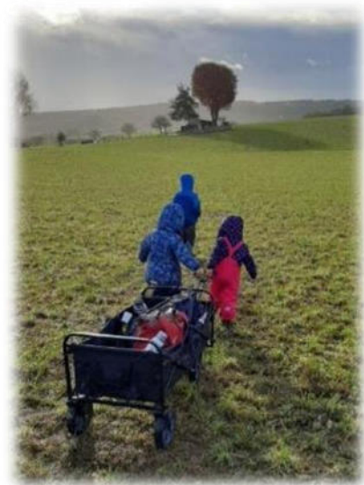
Abbildung 10: co.natur gGmbH Waldkindergarten Heimsheim

Um 8.30 Uhr beginnt der Begrüßungskreis. Hier werden Begrüßungslieder gesungen, die anwesenden Kinder und Betreuungspersonen gezählt und gemeinsam überlegt, welche Kinder fehlen. Dann geht die Gruppe auf Expedition in den Wald. Ggf. kann es auch Aktionen am Bauwagenplatz geben, wie z.B. Vorschule, Essenszubereitung oder Freispiel. Zwischen 12.30 Uhr und 13.30 Uhr können die Kinder am Bauwagen/Waldgrundstück abgeholt werden. Die Betreuungspersonen haben dann auch Zeit für Tür- und Angelgespräche.