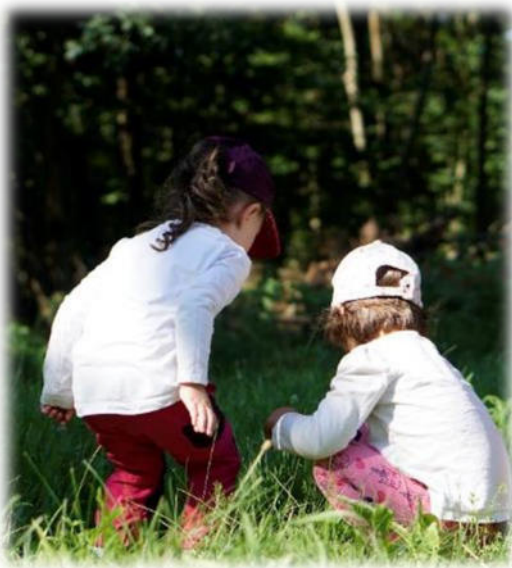
Abbildung 2: co.natur gGmbH Waldkindergarten Heimsheim

Im Wald gibt es Material in Hülle und Fülle, aber richtig Spaß hat man damit erst, wenn man es gemeinsam verwendet; etwas zusammenbaut oder bastelt. Vom Spielmaterial wird nichts vordefiniert und deswegen kann sich die Spielsituation den momentanen Bedürfnissen der Kinder anpassen. Die Kinder lernen: Es gibt von allem genug, damit wir alle spielen können! Und je nachdem wie viele gerade in der Gruppe sind, können die Gegebenheiten der Anzahl der Kinder völlig flexibel angepasst werden. Konkurrenz ist im Wald kaum ein Thema, weil um nichts konkurriert werden muss. Hinzu kommt, dass man im Wald viel mehr aufeinander angewiesen ist, sei es beim Hinaufsteigen eines Berges, beim Überqueren eines Baches oder beim Hochklettern eines Baumes.