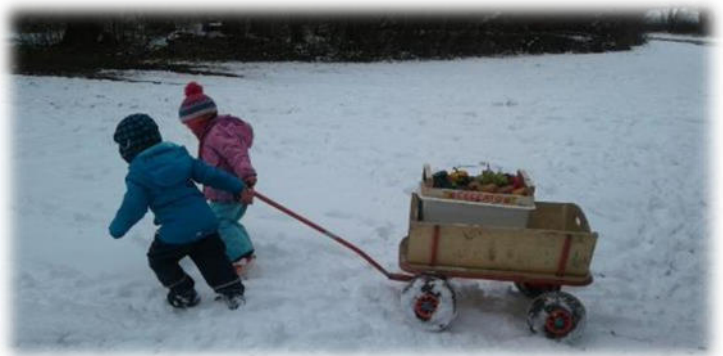
Abbildung 8: co.natur gGmbH Waldkindergarten Heimsheim

Im Winter kann es sehr kalt werden. Dann wird auf warme Kleidung (und zusätzlich Handschuhe und Mütze) geachtet sowie auf Aufwärm- und Bewegungsmöglichkeiten der Kinder, z.B. im Bauwagen. Außerdem ist es empfehlenswert, dass die Kinder warmes Vesper und Tee in Thermobehälter mitbringen.