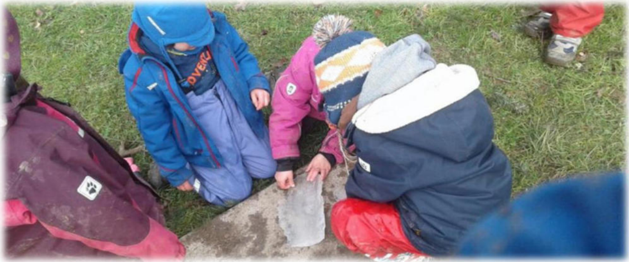
Abbildung 29: co.natur gGmbH Waldkindergarten Heimsheim

Diese Beobachtungsdokumentationen werden im Sozialdatenschutz vertraulich behandelt.