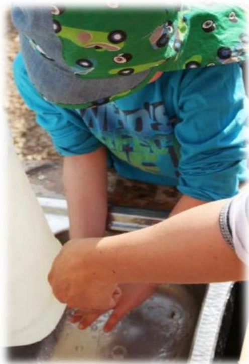
Abbildung 6: co.natur gGmbH Waldkindergarten Heimsheim

Nach jedem Toilettengang und vor dem Essen ist eine gründliche Reinigung der Hände mit Wasser und Seife notwendig. Die Kinder reinigen die Hände mit mitgebrachtem Wasser (Trinkwasserqualität) und pH-neutraler, abbaubarer Flüssigseife (die Bodenbelastung durch die Flüssigseife ist vernachlässigbar). Pro Person haben wir eine Wassermenge von ca. 500 ml dabei. Der Wasserkanister wird täglich neu mit Trinkwasser befüllt. 2 Kanister werden immer abwechselnd benutzt, um ein zwischenzeitliches komplettes Trocknen zu gewährleisten und damit der Biofilmbildung vorzubeugen. Der Kanister steht im Schatten und damit tagsüber vor direkter Sonneneinstrahlung geschützt, um eine Keimvermehrung zu verhindern. Am Ende des Arbeitstages wird der Kanister vollständig zu entleert und getrocknet. Der Kanister ist für Lebensmittel geeignet und im Winter ist er durch einen Thermobehälter gegen Frost geschützt. Das Wasser aus diesem Kanister wird nur für die Händehygiene verwendet. Zur Händetrocknung hat jedes Kind ein eigenes Stoffhandtuch dabei, das täglich gewechselt wird.