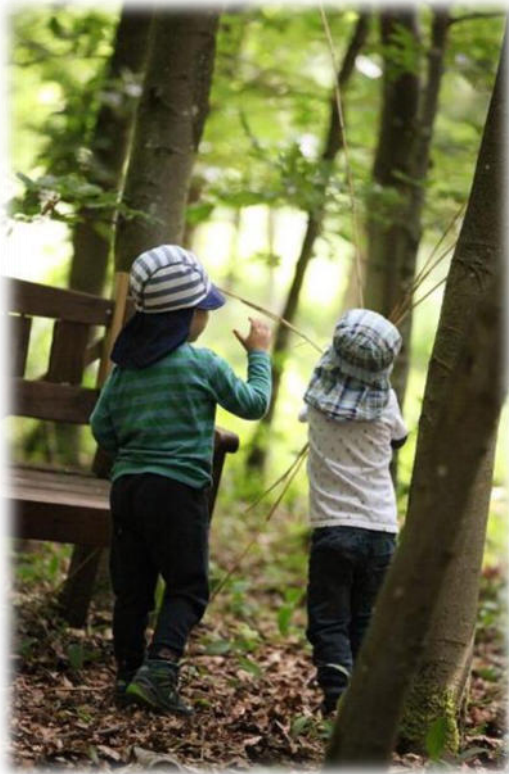
Abbildung 30: co.natur gGmbH Waldkindergarten Heimsheim

Eine tiefgehende Untersuchung zur vorschulischen Erziehung zeigt die Promotionsarbeit von Peter Häfner: