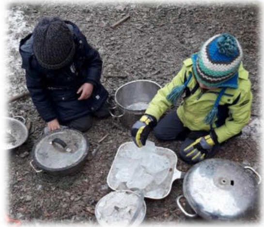
Abbildung 17: co.natur gGmbH Waldkindergarten Heimsheim