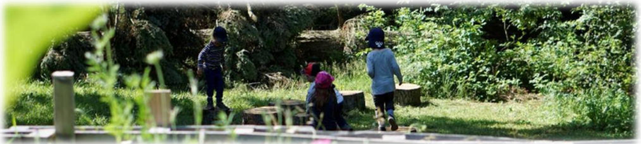
Abbildung 16: co.natur gGmbH Waldkindergarten Heimsheim

Wir achten auf eine wertschätzende Haltung und Sprache und fördern das aktive Zuhören. Wir sind soziale Vorbilder und leben den Kindern Mitgefühl („Ich fühle mit dir“) und Empathie („Ich verstehe dich“) vor.