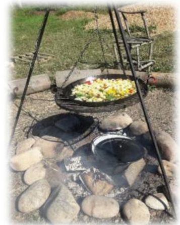
Abbildung 18: co.natur gGmbH Waldkindergarten Heimsheim