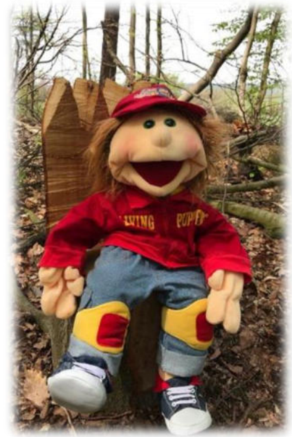
Abbildung 31: co.natur gGmbH Waldkindergarten Heimsheim

Das Programm soll den Kindern und Eltern den Bereich der Prävention von sexueller Gewalt näherbringen. Wir üben mit den Kindern das Verhalten gegenüber Fremden an der Haustüre, auf dem Spielplatz und in anderen geläufigen Situationen. Den Kindern wird dabei eine innere Fragenstraße beigebracht. Sie ist der eigentliche Schlüssel der Gewaltprävention. Durch Spiele und Wiederholungen wird ein Werkzeug geschaffen, welches Kindern das Vertrauen schenkt, auf die eigenen Gefühle zu achten und diese zuzulassen. Das Programm soll allen, die an der Erziehung beteiligt sind, helfen, die Kinder stark zu machen.