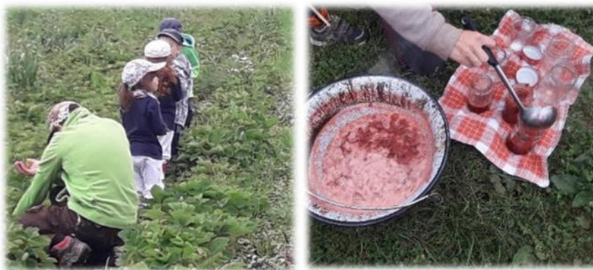
Abbildung 21: co.natur gGmbH Waldkindergarten Heimsheim

Arbeitsprozesse werden nach Möglichkeit in den Außenbereich verlagert, sodass ein ausgewogenes Verhältnis zwischen Tätigkeiten im Innen- und Außenbereich besteht. [...] Dieser Anspruch wird von den Waldkindergärten weitestgehend realisiert. Objekt- und kulturgebundene Innenraumtätigkeiten lernt das Waldkindergartenkind ohnehin in der verbleibenden Familienzeit kennen [...] Auf Lob wird weitestgehend verzichtet. [...]