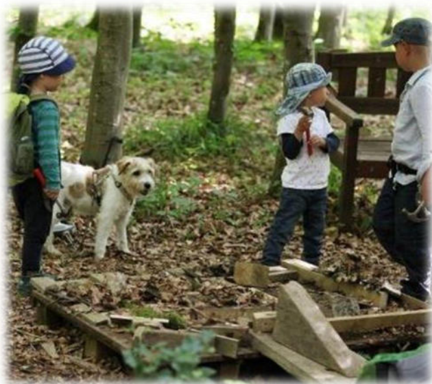
Abbildung 25: co.natur gGmbH Waldkindergarten Heimsheim

Kinder haben einen Willen, dieser Wille soll und darf geäußert werden und wir achten darauf, diesem nach Möglichkeit auch nachzukommen. Alle Kinder haben das Recht ihre Meinung zu sagen und diese wird respektiert.