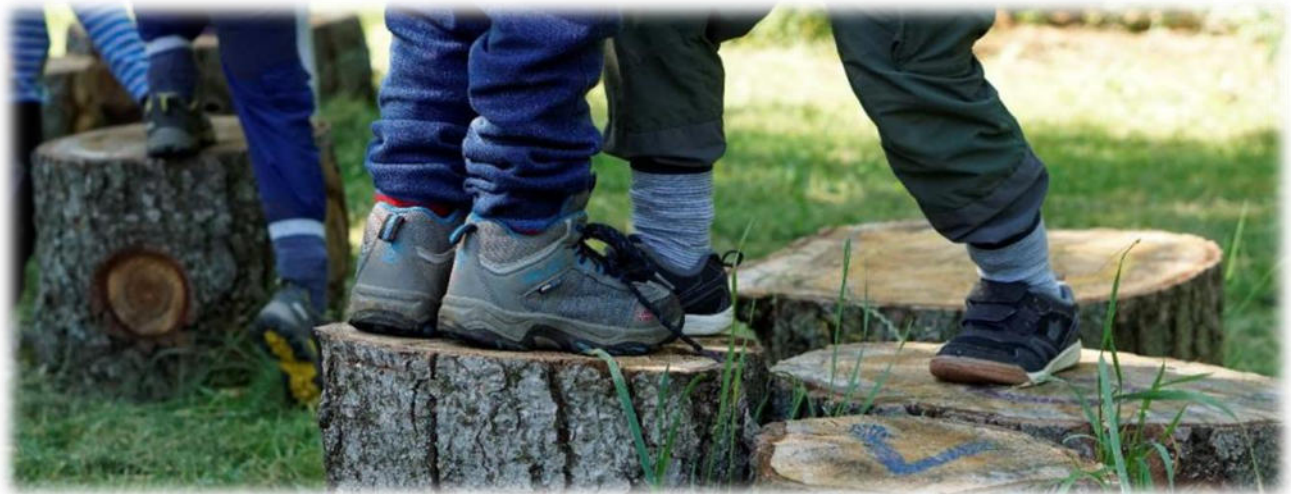
Abbildung 2: co.natur gGmbH Waldkindergarten Heimsheim

Freispiel ist spielen lassen unter Aufsicht. Es ist ein komplexes Geschehen während einer bestimmten Zeitdauer, das sich jedes Mal neu aus spontanem Tätigwerden der Kinder und Zurückhaltung der pädagogischen Fachkräfte entwickelt. Das Freispiel ist vollkommen frei. Die Kinder können spielen, mit wem und was sie wollen.