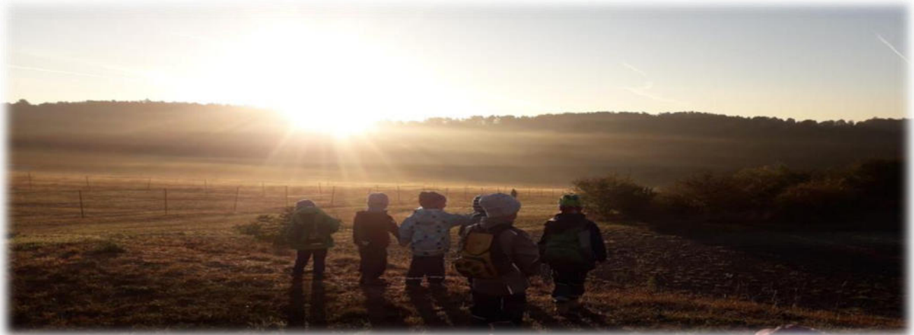
Abbildung 9: co.natur gGmbH Waldkindergarten Heimsheim