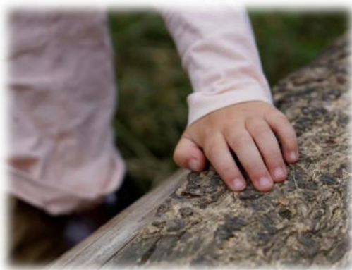
Abbildung 15: co.natur gGmbH