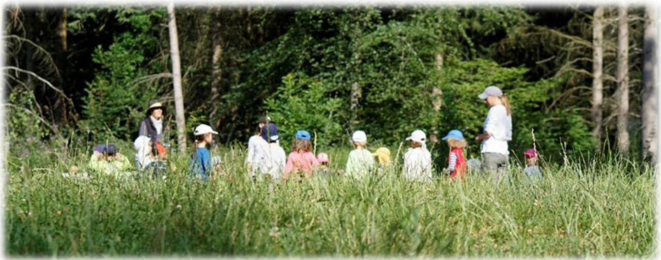
Abbildung 3: co.natur gGmbH Waldkindergarten Heimsheim

Gerade in einer Gesellschaft, in der viel über Mobbing, Cyber-Mobbing, Burn-Out, ADHS und Depressionen gesprochen wird, ist es wichtig, dass Kinder schon ganz früh Ressourcen nicht nur theoretisch lernen - sondern verinnerlichen und trainieren: Wie gehe ich mit den Gefühlen Wut, Frustration, Angst oder Traurigkeit um. Der Wald bietet hier viele Möglichkeiten.