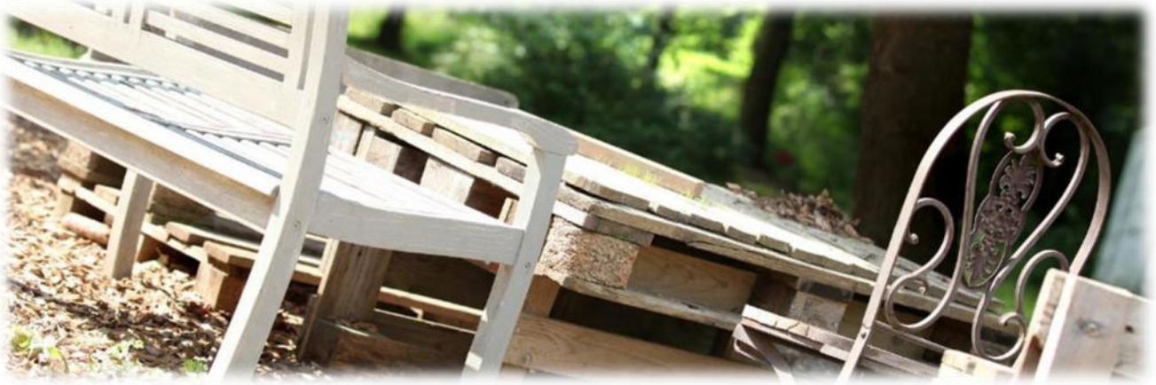
Abbildung 14: co.natur gGmbH Waldkindergarten Heimsheim

Außerdem bekommen alle Mitarbeitenden jährlich eine Brandschutzunterweisung.