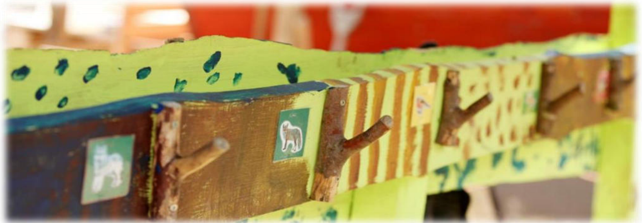
Abbildung 28: co.natur gGmbH Waldkindergarten Heimsheim

Die Eingewöhnung eines neuen Kindes erfolgt in Absprache mit den pädagogischen Fachkräften und ist individuell. Eine Fachkraft übernimmt die Eingewöhnung eines Kindes und geht eine vertrauensvolle Beziehung mit dem Kind ein. Nur ein Kind, das sich sicher und wohlfühlt, kann sich entspannt von den Eltern lösen und sich auf den Kindergarten freuen. Es braucht auch die Bereitschaft der Eltern, sich von ihrem Kind zu lösen, um ihm einen guten Start im Kindergarten zu ermöglichen. Daher legen wir bei der Eingewöhnung auch Wert darauf, dass die Eltern sich wohlfühlen.