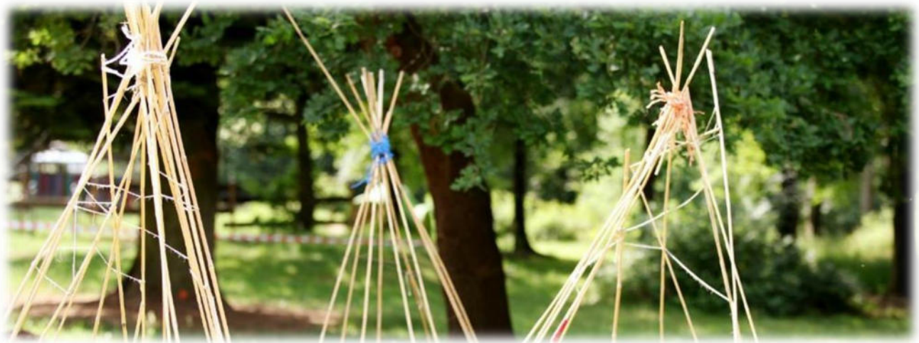
Abbildung 33: co.natur gGmbH Waldkindergarten Heimsheim

Eine vertrauensvolle und intensive Zusammenarbeit zwischen Eltern und pädagogischen Fachkräften ist eine wichtige Voraussetzung dafür, dass die ganzheitliche Förderung der kindlichen Persönlichkeit gelingt. Wir wollen, dass die Eltern ihre Kinder gut aufgehoben wissen und sich aktiv beteiligen. Wir legen Wert auf Mitarbeit und partnerschaftliches Miteinander sowie darauf, die Familie des Kindergartenkindes zu integrieren. Wir machen Veranstaltungen für die ganze Familie. Es gibt Geschwister-Besuchstage und Tage für ehemalige Kindergartenkinder, an denen diese zu Besuch kommen können, um liebgewonnene Erfahrungen und Aktivitäten aufzufrischen. Uns liegt die verlässliche Bindung zwischen Kindern und den pädagogischen Fachkräften sowie der partnerschaftliche Austausch mit den Eltern am Herzen.