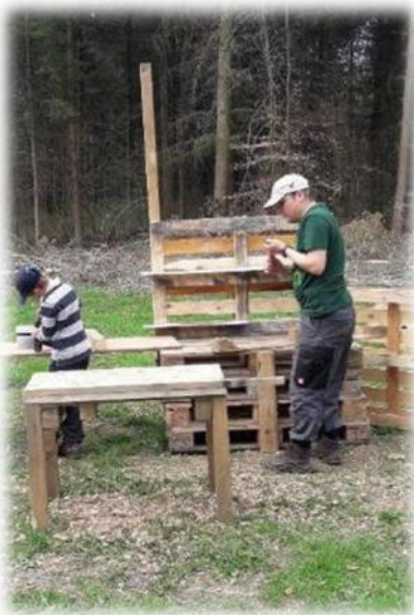
Abbildung 34: co.natur gGmbH Waldkindergarten Heimsheim

Nur mit der aktiven Mitarbeit von Eltern ist es möglich, den Waldkindergarten aufrechtzuerhalten. Eltern sind aber auch Vorbild und leben einen Gemeinschaftssinn vor. Die aktive Mitarbeit von Eltern ist wichtig für die Öffentlichkeitsarbeit, spart Geld für Neuanschaffungen, sorgt für ein Gefühl der Gemeinschaft und macht zudem noch Spaß.