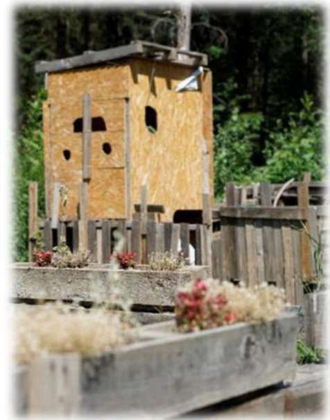
Abbildung 12: co.natur gGmbH Waldkindergarten Heimsheim

Aufgrund der Autarkie bietet es sich bei uns an, das Thema Umwelt- und Naturschutz immer im Alltag zu thematisieren. Es beginnt damit, dass wir Feuer brauchen, damit es uns warm ist und wir kochen und abwaschen können. Somit gehen die Kinder regelmäßig kleines Brennholz zum Anfeuern suchen und wir thematisieren dabei die Kreisläufe in der Natur und wieso die Pflanzen so wichtig für uns sind. Es gibt auch kein fließendes Wasser. Das bedeutet, wir gehen sparsam und effektiv mit dem Wasser um, was wir haben. Wir fangen Regenwasser auf, um die Beete zu gießen. Auch das Wasser vom Händewaschen (mit biolog. Seife) fangen wir auf und gießen damit unsere Sträucher. Wir erhitzen Wasser, um zu kochen und Geschirr zu spülen. Wir sind uns der Endlichkeit unserer Ressourcen im Alltag bewusst und leben sparsam und nachhaltig.