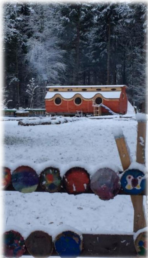
Abbildung 1: co.natur gGmbH Waldkindergarten Heimsheim