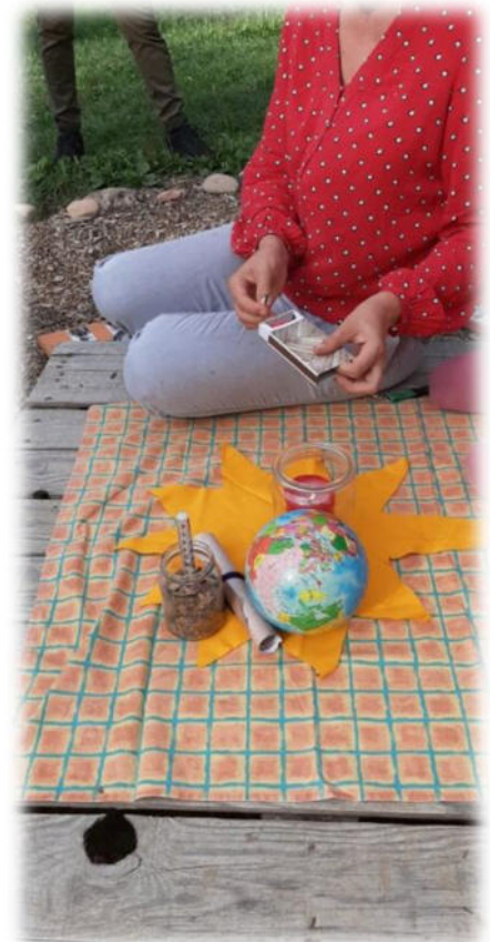
Abbildung 36: co.natur gGmbH Waldkindergarten Heimsheim

Wichtig hierbei ist nur die Art und Weise, diese Fehler zu betrachten, zu bewerten und damit umzugehen. Um einen konstruktiven Umgang mit Fehlern gewährleisten zu können, müssen sie offen benannt, eingestanden und aufgearbeitet werden und können so zur Verbesserung unserer Arbeit führen. Fehlverhalten oder Sachverhalte, deren Sinn und Hintergrund nicht verstanden werden, sprechen unsere Mitarbeitenden offen bei Kollegen und Kolleginnen, im Team und gegenüber Leitungen und Geschäftsleitung an. Es ist uns wichtig, dass unsere Mitarbeitenden auf ihre physischen und psychischen Grenzen achten, gesundheitliche Beeinträchtigungen ernst nehmen und sich bei Bedarf rechtzeitig Hilfe holen.