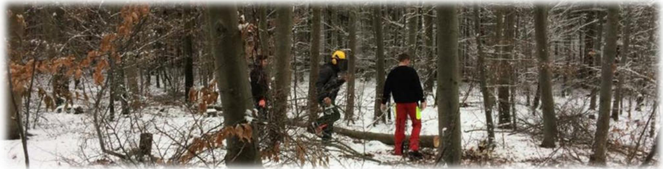
Abbildung 7: co.natur gGmbH Waldkindergarten Heimsheim

Das Wetter kann immer wieder zu einer Gefahr werden. Allgemein ist es immer wichtig, dem Wetter entsprechend gekleidet zu sein. Regenkleidung und Wechselkleidung ist immer vorhanden.