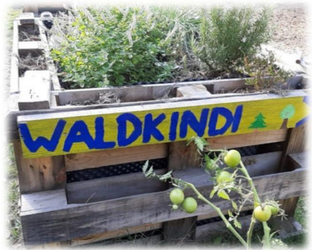
Abbildung 37: co.natur gGmbH Waldkindergarten Weil der Stadt

Kinder äußern ihre Beschwerden oft nicht direkt. Ihre Anliegen und Bedürfnisse, die hinter einer Beschwerde im weitesten Sinne liegen, können sehr unterschiedlich aussehen. Dies kann ein Unwohlsein, eine Unzufriedenheit sein (z. B. mit dem Essen), es kann sich um einen Veränderungswunsch handeln (z. B. bezüglich einer Gruppenregel) oder ein Thema betreffen, das sich aus dem Verhalten und den Reaktionen anderer ergibt (z. B. dem Konflikt, nicht mitspielen zu dürfen). Unsere Mitarbeitenden sind gefordert, die Unmutsbekundungen der Kinder bewusst wahrzunehmen und sich mit ihnen auf die Suche nach dem zu begeben, was hinter der Beschwerde steckt. Deshalb spielen alle Anliegen -auch die, die aus Sicht der Erwachsenen „Kleinigkeiten“ oder „Banales“ darstellen - für uns eine wichtige Rolle. Durch unser Interesse an ihrer Kritik fühlen sich die Kinder ernst genommen und suchen auch bei anderen Sorgen unsere Unterstützung. Die Kinder nutzen im Kindergartenalltag oft informelle Wege, um ihre Unzufriedenheit zu äußern. Sie äußern ihre Beschwerde nicht immer eindeutig und direkt. Dabei müssen sie sicher sein, dass ihre Anliegen ernst genommen werden. Auf die Festlegung einer "Beschwerdestelle" oder eines starren Verfahrens haben wir ganz bewusst verzichtet. Unsere Erfahrung ist, dass sich die Kinder in aller Regel an Mitarbeitende ihres Vertrauens wenden, wenn sie Anliegen haben und sich besprechen wollen.