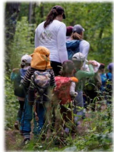
Abbildung 35: co.natur gGmbH Waldkindergarten Heimsheim

Unsere Mitarbeitenden nehmen aktiv Stellung gegen diskriminierendes, gewalttätiges und sexistisches Verhalten und greifen in solchen Fällen auch sofort ein. Wenn die Mitarbeitenden Kenntnis von einem Sachverhalt erhalten, der die Vermutung auf ein Fehlverhalten durch einen Mitarbeitenden nahelegt, wird dies umgehend dem unmittelbaren Vorgesetzten als auch der Geschäftsführung mitgeteilt. Das pädagogische Handeln unserer Mitarbeitenden ist transparent und nachvollziehbar und entspricht fachlichen Standards. Es werden vorhandene Strukturen und Abläufe eingehalten und dokumentiert. Dabei wird sich nach den Bedürfnissen der Kinder gerichtet und mit den Eltern bzw. Sorgeberechtigten kollegial und transparent zusammengearbeitet.