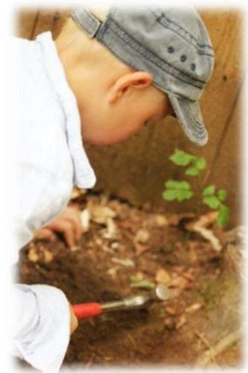
Abbildung 19: co.natur gGmbH Waldkindergarten Heimsheim

Die Erziehenden vermitteln einen ressourcenschonenden, ökologisch verantwortbaren, gesunden und sparsam-wirtschaftenden Lebensstil. Sparsames Wirtschaften schont Ressourcen. Beispiel: Wenn ich sparsam wirtschaftete, gehe ich behutsam mit meiner endlichen Arbeitskraft um. Mittel müssen erworben werden. In allem Bestand, der mich umgibt, steckt ein Stück Lebenszeit. Das gilt es den Kindern zu vermitteln! Deshalb gehört zum sparsamen Wirtschaften die Bestandspflege, die Pflege bereits erworbener Güter. Achtsamkeit kommt von Achtung - Achtung, die ich einem Gebrauchsgegenstand entgegenbringe (z.B. die Schuhpflege).