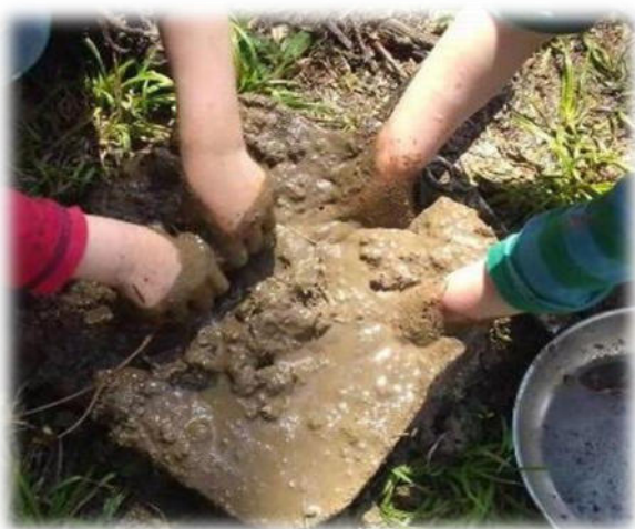
Abbildung 20: co.natur gGmbH Waldkindergarten Heimsheim

Wenn wir unsere Kinder ernst nehmen, dann sollten wir sie an der realen, ernsthaften Lebenswirklichkeit teilhaben lassen. Und da sind es vor allem die alltagstauglichen Fertigkeiten, die zählen: Arbeiten, die Tag für Tag in der Lebensgemeinschaft Familie oder in einer Kindertageseinrichtung anfallen, die getan werden müssen, um die Versorgung dieser Gemeinschaft zu gewährleisten. Dabei eröffnet sich ein Betätigungsfeld, das weit über die Nahrungszubereitung hinausgeht.