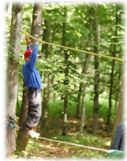
Abbildung 4: co.natur gGmbH Waldkindergarten Heimsheim

Deswegen ist es unerlässlich, dass Kinder wieder die Natur ganz elementar kennenlernen, weil es für den Fortbestand unserer Kultur wichtig ist, dass die Natur geachtet und geschützt wird. Nur wer die Natur in ihrer Einzigartigkeit kennen-gelernt hat, kann zu ihrer Erhaltung beitragen.