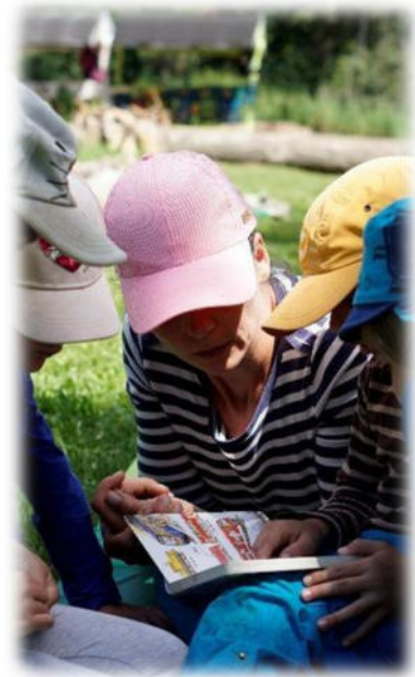
Abbildung 13: co.natur gGmbH Waldkindergarten Heimsheim

Es sind jeden Tag, während der gesamten Öffnungszeit, mindestens 2 Personen zeitgleich vor Ort (wovon mindestens eine davon eine Fachkraft ist). In der Kernzeit von 8.30 Uhr bis 12.30 Uhr sind mindestens 3 Mitarbeitende zeitgleich im Wald eingesetzt, wovon mindestens einer davon eine Fachkraft ist. Im Rahmen der finanziellen und organisatorischen Möglichkeiten sichern wir die regelmäßige Anwesenheit von 3 - 5 Personen. Vertretungen aufgrund von Krankheit, Fortbildung, etc. werden durch die Flexibilität von Teilzeit-Angestellten und durch ehrenamtliche Mithilfe von Eltern sichergestellt.