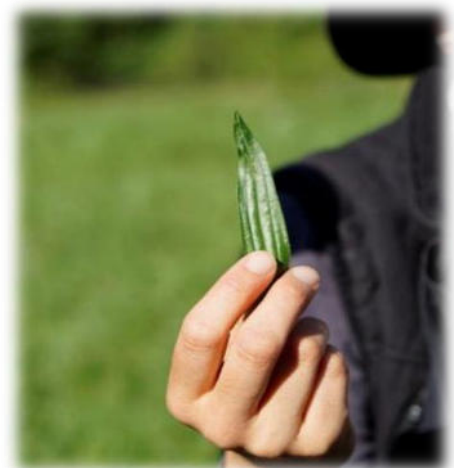
Abbildung 23: co.natur gGmbH Waldkindergarten Heimsheim

„Alles zu seiner Zeit“? Ja, bitte! Was wollen Eltern einem Schulkind noch bieten, das durch eben solche Vorwegnahmen nur desinteressiert antworten kann: „Alter Hut, das kenn' ich schon!“ Auf der Strecke bleibt das Wissen und die Beheimatung stiftende Kenntnis des näheren Wohnumfeldes und deren Flora und Fauna mit der Chance, hier lebenspraktisch tätig werden zu können. Ich habe als Kind im Sommer Kamille sammeln dürfen bzw. müssen. Ohne dass das Beutelchen voll war, brauchte ich nicht heimzukommen. Ich wusste um die Sinnhaftigkeit, Notwendigkeit meines Tuns. Ich war eingebunden in nützliche, weil notwendige Tätigkeitsabläufe. Viele standen im Zusammenhang mit einer bestimmten Jahreszeit.