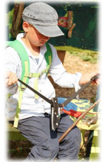
Abbildung 32: co.natur gGmbH Waldkindergarten Heimsheim