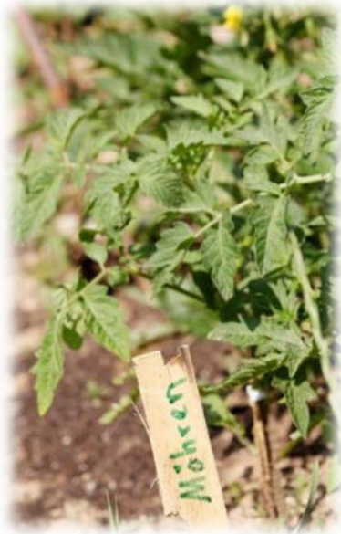
Abbildung 13: co.natur gGmbH Waldkindergarten Heimsheim

Der Schwerpunkt des Waldkindergartens Mönshheim liegt in den Bereichen: