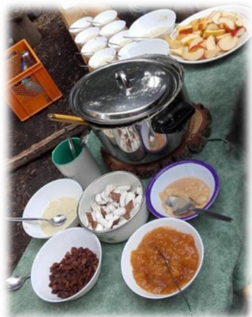
Abbildung 12: co.natur gGmbH Waldkindergarten Mönshheim

Bei uns wird Partizipation gelebt. Einmal wöchentlich findet unsere Kinderkonferenz statt, in der die Kinder die Möglichkeit haben unseren Alltag mitzugestalten. In der Konferenz können die Kinder auch ihre Beschwerden äußern. Das Ergebnis dieser Konferenz dient als Grundlage unserer Planung.