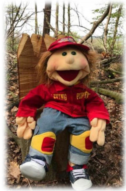
Abbildung 32: co.natur gGmbH Waldkindergarten Heimsheim

Das Programm soll den Kindern und Eltern den Bereich der Prävention von sexueller Gewalt näherbringen. Wir üben mit den Kindern das Verhalten gegenüber Fremden an der Haustüre, auf dem Spielplatz und in anderen geläufigen Situationen. Den Kindern wird dabei eine innere Fragenstraße beigebracht. Sie ist der eigentliche Schlüssel der Gewaltprävention. Durch Spiele und Wiederholungen wird ein Werkzeug geschaffen, welches Kindern das Vertrauen schenkt, auf die eigenen Gefühle zu achten und diese zuzulassen. Das Programm soll allen, die an der Erziehung beteiligt sind, helfen, die Kinder stark zu machen.