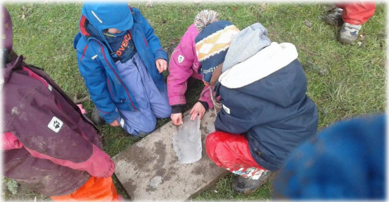
Abbildung 30: co.natur gGmbH Waldkindergarten Heimsheim

Für jedes Kind werden jeweils zum Geburtstag diese Beobachtungsmethoden angewandt bzw. vervollständigt.