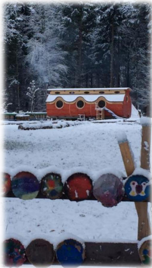
Abbildung 1: co.natur gGmbH Waldkindergarten Heimsheim