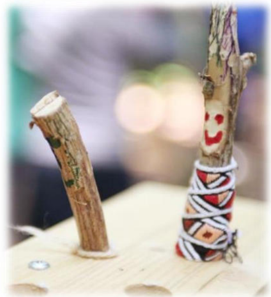
Abbildung 27: co.natur gGmbH Waldkindergarten Heimsheim

Den Kindern werden viele Fragen gestellt, um sie zum Mitdenken zu ermuntern. Durch das Abzählen einzelner Dinge, die gesammelt werden und auch das Abzählen der Kinder im Begrüßungskreis, etc. wird das Konzept der Mengen aufgegriffen. Gesammeltes Material wird zum Basteln in verschiedene Kategorien (z.B. nach Farbe oder Form) eingeteilt. Die Mitarbeitenden erklären, lassen ausprobieren und experimentieren. So können die Kinder möglichst viele Erfahrungen sammeln und eigene Antworten finden. Durch das eigene Anbauen von Gemüse und Obst sowie durch das Spielen im Garten oder im Wald entwickeln die Kinder eine Wertschätzung gegenüber der Natur. Auch Regeln werden mit den Kindern gemeinsam aufgestellt. Der Grund dieser Regeln wird besprochen und bei Bedarf verändert.