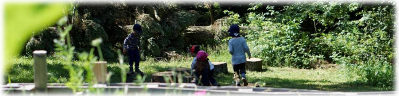
Abbildung 17: co.natur gGmbH Waldkindergarten Heimsheim