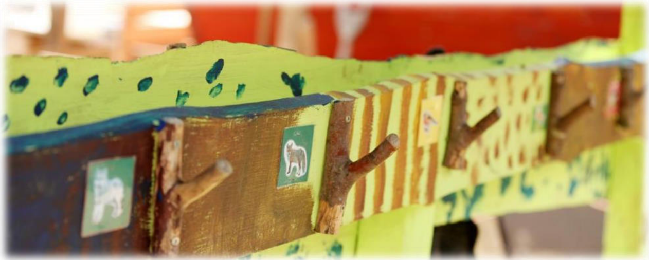
Abbildung 29: co.natur gGmbH Waldkindergarten Heimsheim

Die Eingewöhnung eines neuen Kindes erfolgt in Absprache mit den pädagogischen Fachkräften und ist individuell. Eine Fachkraft übernimmt die Eingewöhnung eines Kindes und geht eine vertrauensvolle Beziehung mit dem Kind ein. Nur ein Kind, das sich sicher und wohlfühlt, kann sich entspannt von den Eltern lösen und sich auf den Kindergarten freuen. Es braucht auch die Bereitschaft der Eltern, sich von ihrem Kind zu lösen, um ihm einen guten Start im Kindergarten zu ermöglichen. Daher legen wir bei der Eingewöhnung auch Wert darauf, dass die Eltern sich wohlfühlen.