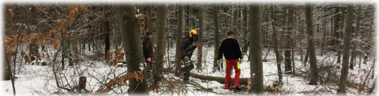
Abbildung 7 co.natur gGmbH Waldkindergarten Heimsheim

Zu den üblichen Gefahren gehören auch lose Äste in großer Höhe. Um sie zu entfernen, kommen regelmäßig Baumpfleger und überprüfen unsere Waldplätze, an denen wir uns vermehrt aufhalten. Es gibt eine erhöhte Verkehrssicherungspflicht in den Waldgebieten, die wir verstärkt nutzen und die markiert sind. Die Verkehrssicherung macht der Baumpfleger oder Baumpflegerin in Abstimmung mit den Forstbeschäftigten. Bei Forstarbeiten wird ein ausreichender Sicherheitsabstand eingehalten.