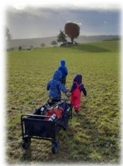
Abbildung 10: co.natur gGmbH Waldkindergarten Heimsheim

Zwischen 12.30 Uhr und 13.30 Uhr können die Kinder im Kindergarten abgeholt werden.