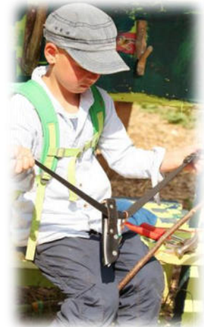
Abbildung 33: co.natur gGmbH Waldkindergarten Heimsheim