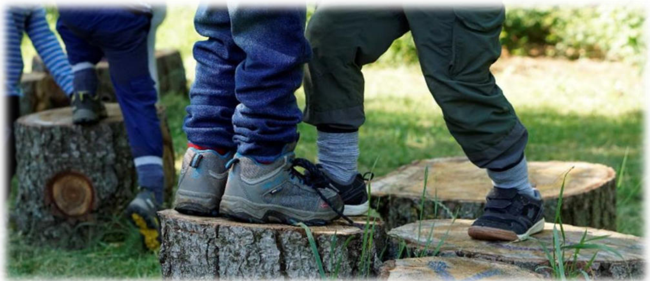
Abbildung 25: co.natur gGmbH Waldkindergarten Heimsheim

Während dem Freispiel wird die Selbständigkeit der Kinder gefördert, denn sie müssen entscheiden, wo, was und mit wem sie spielen wollen. Die Kinder erleben sich als autonom (sie entscheiden selbst, kein Erwachsener entscheidet für sie). Sie können spielerisch die Sprache lernen, sich ausprobieren, neue Spiele kennenlernen und in ihrer eigenen Welt versinken. Außerdem wird die Motorik gefördert und die Fantasie angeregt.