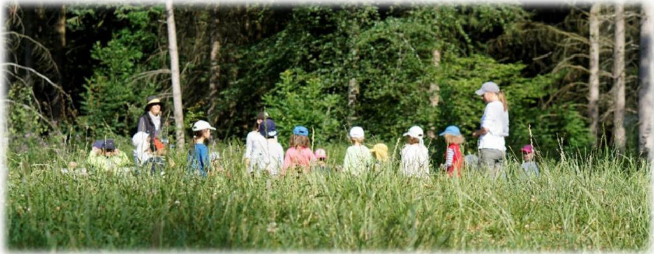
Abbildung 3 co.natur gGmbH Waldkindergarten Heimsheim

Gerade in einer Gesellschaft, in der viel über Mobbing, Cyber-Mobbing, Burn-Out, ADHS und Depressionen gesprochen wird, ist es wichtig, dass Kinder schon ganz früh Ressourcen nicht nur theoretisch lernen - sondern verinnerlichen und trainieren: Wie gehe ich mit den Gefühlen Wut, Frustration, Angst oder Traurigkeit um. Der Wald bietet hier viele Möglichkeiten.