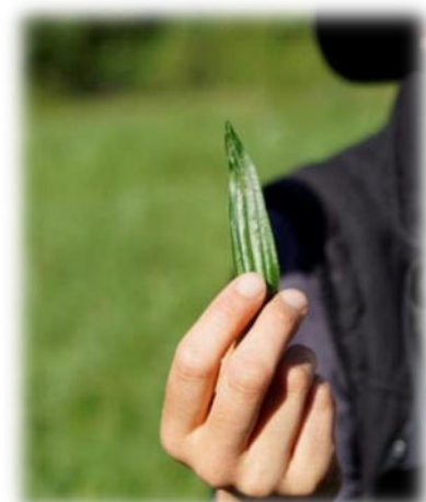
Abbildung 24: co.natur gGmbH Waldkindergarten Heimsheim

„Alles zu seiner Zeit“? Ja, bitte! Was wollen Eltern einem Schulkind noch bieten, das durch eben solche Vorwegnahmen nur desinteressiert antworten kann: „Alter Hut, das kenn' ich schon!“ Auf der Strecke bleibt das Wissen und die Beheimatung stiftende Kenntnis des näheren Wohnumfeldes und deren Flora und Fauna mit der Chance, hier lebenspraktisch tätig werden zu können. Ich habe als Kind im Sommer Kamille sammeln dürfen bzw. müssen. Ohne dass das Beutelchen voll war, brauchte ich nicht heimzukommen. Ich wusste um die Sinnhaftigkeit, Notwendigkeit meines Tuns. Ich war eingebunden in nützliche, weil notwendige Tätigkeitsabläufe. Viele standen im Zusammenhang mit einer bestimmten Jahreszeit. Die Natur gab ein Zeitfenster vor, das genutzt werden musste. Und die Eltern hielten mich dazu an. Und so ganz nebenbei lernte ich die Namen von Pflanzen - hier Heilkräutern - und deren wohltuende Wirkung auf den menschlichen Organismus.