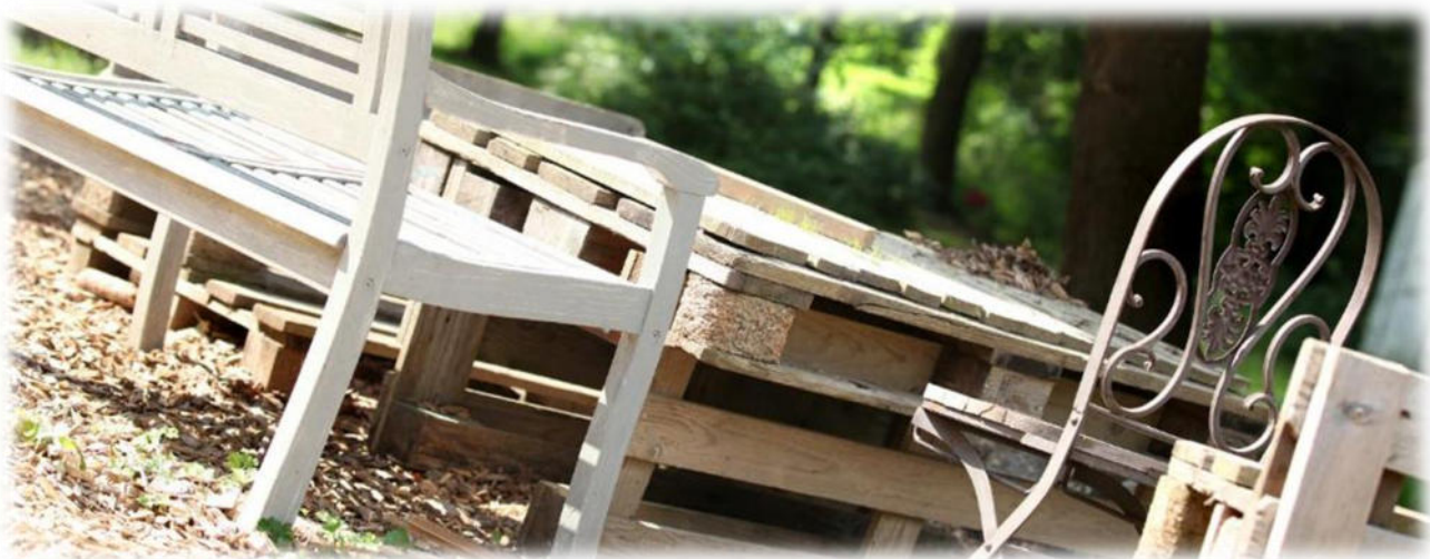
Abbildung 15: co.natur gGmbH Waldkindergarten Heimsheim

Die Teamsitzungen finden wöchentlich statt.