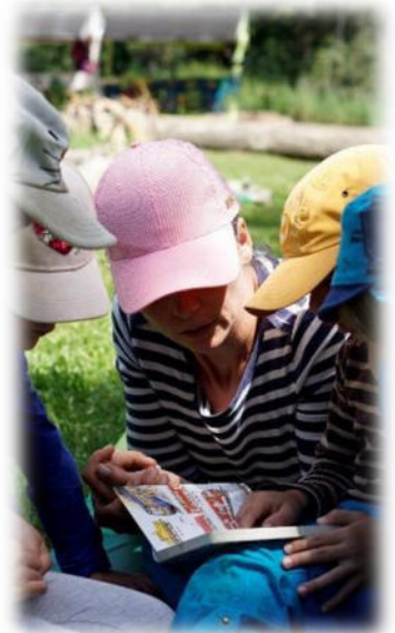
Abbildung 14: co.natur gGmbH Waldkindergarten Heimsheim

Das pädagogische Personal setzt sich aus 4-5 Fachkräften, in Voll- oder Teilzeit mit unterschiedlichen Qualifikationen zusammen. Wir haben ein vielfältiges Team, in das sich jeder durch verschiedene Alters- und Lebenserfahrungen einbringen kann.