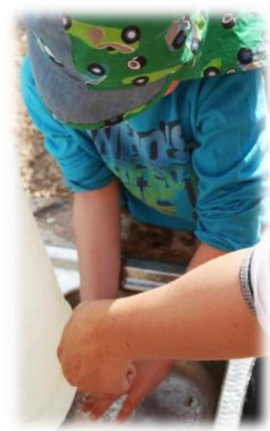
Abbildung 6 co.natur gGmbH Waldkindergarten Heimsheim

Kinder benutzen bei Wanderungen die Waldtoilette. Dazu werden abseits gelegene Plätze ausgewiesen, die regelmäßig wechseln und an denen nicht gespielt wird. Die Fäkalien und das Toilettenpapier werden nach dem „großen Geschäft“ mit dem Spaten vergraben. Der Spaten wird nur für diesen Zweck benutzt und wird in einer Tüte außen am Rucksack zu befestigt. Das Toilettenpapier wird hiervon getrennt aufbewahrt. Auch bei längeren Frostperioden sind im Wald häufig noch unter Laubresten nicht durchgefrorene Bodenbereiche zu finden. Bei dauergefrorenem Boden können die Exkremente nicht vergraben werden, dann werden Hundekottüten verwendet. Ggf. werden in einem markierten Bereich auch kleine Gruben vor der Dauerfrostperiode ausgegraben, die dann genutzt werden und mit Laub oder Rindenmulch abgedeckt werden. Werden für die "Waldtoilette" Toilettensitze, Töpfchen ohne Boden oder WC-Brillen verwendet, werden diese nach jeder Benutzung mit geeigneten Reinigungsmitteln gereinigt.