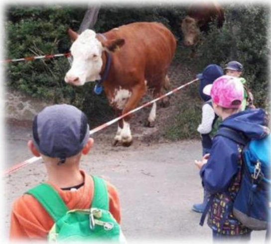
Abbildung 23: co.natur gGmbH Waldkindergarten Heimsheim

Die Erkundung des Lebensumfeldes steht im Vordergrund; dabei wird auf Surrogate weitestgehend verzichtet, die Ersterfahrung erfolgt am realen Objekt. [...] Bilderbücher vermitteln nur ein Abbild der Wirklichkeit. Und wenn der erste Eindruck eines Kleinkindes von einer Kuh via Papier erfolgt, so geht Entscheidendes verloren. Das Kind riecht die Kuh, den Kuhstall nicht. Das Kind „begreift“ die Kuh nicht, spürt nicht die unglaubliche Weichheit des Kuhmauls, erlebt nicht die Bewegungsabfolgen des Kuhkörpers, erfährt nicht die Reaktion der Kuh auf sein Tun, den Nuancenreichtum der Fellfärbung [...] Die erste Speicherung im Gehirn von einem „Kuhbild“ ist dürftig