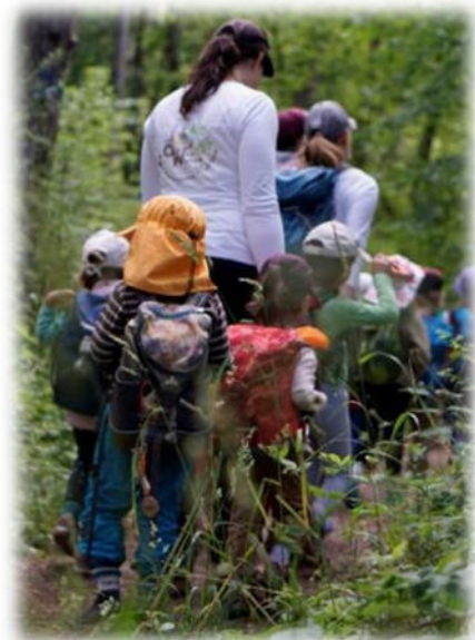
Abbildung 36: co.natur gGmbH Waldkindergarten Heimsheim

Unsere Mitarbeitenden nehmen aktiv Stellung gegen diskriminierendes, gewalttätiges und sexistisches Verhalten und greifen in solchen Fällen auch sofort ein. Wenn die Mitarbeitenden Kenntnis von einem Sachverhalt erhalten, der die Vermutung auf ein Fehlverhalten durch einen Mitarbeitenden nahelegt, wird dies umgehend dem unmittelbaren Vorgesetzten als auch der Geschäftsführung mitgeteilt. Das pädagogische Handeln unserer Mitarbeitenden ist transparent und nachvollziehbar und entspricht fachlichen Standards. Es werden vorhandene Strukturen und Abläufe eingehalten und dokumentiert. Dabei wird sich nach den Bedürfnissen der Kinder gerichtet und mit den Eltern bzw. Sorgeberechtigten kollegial und transparent zusammengearbeitet.