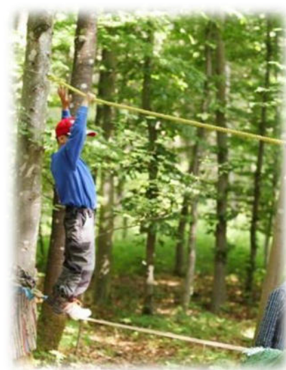
Abbildung 5: co.natur gGmbH Waldkindergarten Heimsheim

Für die Zukunft unserer Erde ist es von großer Bedeutung, dass wir beginnen, die Natur nachhaltig zu schützen. Hier gilt es bereits ganz früh einen Grundstein für den verantwortungsvollen Umgang der Kinder mit und in der Natur zu legen.