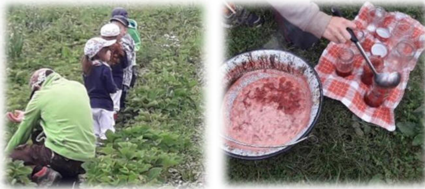
Abbildung 22: co.natur gGmbH Waldkindergarten Heimsheim

Arbeitsprozesse werden nach Möglichkeit in den Außenbereich verlagert, sodass ein ausgewogenes Verhältnis zwischen Tätigkeiten im Innen- und Außenbereich besteht. [...] Dieser Anspruch wird von den Waldkindergärten weitestgehend realisiert. Objekt- und kulturgebundene Innenraumtätigkeiten lernt das Waldkindergartenkind ohnehin in der verbleibenden Familienzeit kennen [...] Auf Lob wird weitestgehend verzichtet. [...]