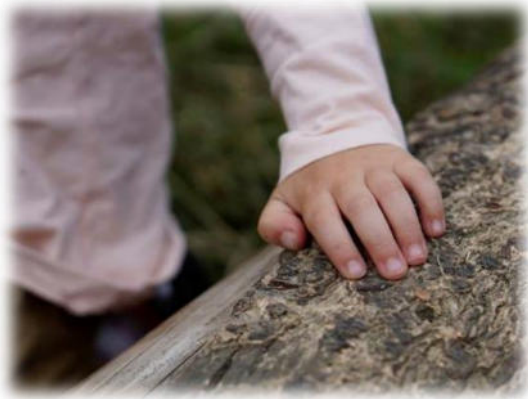
Abbildung 16: co.natur gGmbH Waldkindergarten Heimsheim

Sie sind ein wichtiger und wertvoller Teil der Gemeinschaft und haben dieselben Rechte, wie die Erwachsenen. Kinder wollen dazugehören und sie wollen wachsen. Sie haben Stärken und Schwächen, diese dürfen und sollen gelebt und gezeigt werden dürfen.