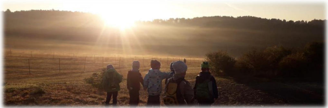
Abbildung 9: co.natur gGmbH Waldkindergarten Heimsheim

Der Rettungsdienst besitzt einen genauen Lageplan, sodass Hilfe schnell vor Ort ist. Das gesamte Gebiet der Waldkindergärten ist innerhalb eines ausreichend starken Mobilfunknetzes. Notruf muss immer über die App „Hilfe im Wald“ abgesetzt werden.