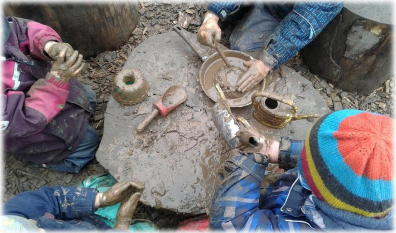
Abbildung 28: co.natur gGmbH Waldkindergarten Heimsheim

Der Spracherwerb gilt als Schlüsselkompetenz, denn durch Sprache eröffnen sich den Kindern weitere Entwicklungsfelder. Grundlegende Voraussetzung für den Spracherwerb ist das genaue Zuhören. Die Stille des Waldes bietet beste Voraussetzungen dafür. Zudem beeinflusst das Spielen mit Naturmaterialien die Sprachentwicklung positiv. Wenn ein Kind seinem Spielpartner erklären muss, ob sein Stock ein Zauberstab oder eine Lanze ist, fördert das automatisch seine Sprachentwicklung.