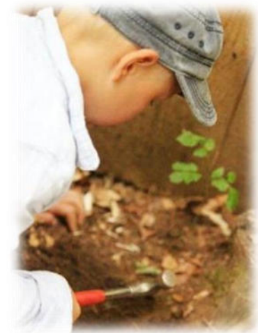
Abbildung 20: co.natur gGmbH Waldkindergarten Heimsheim