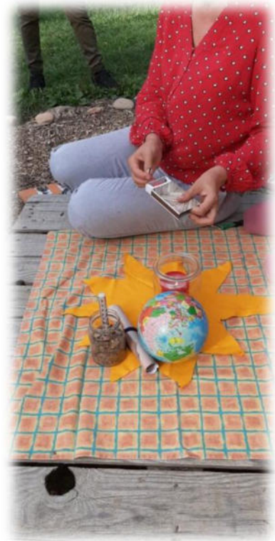
Abbildung 337: co.natur gGmbH Waldkindergarten Heimsheim

Wir achten darauf, dass Informationen zeitnah an Kollegen und Kolleginnen und an die Leitung weitergegeben werden und unterstützen uns gegenseitig im Arbeitsalltag, wenn Hilfe benötigt wird. Das Team geht wertschätzend und respektvoll miteinander um und versucht Konflikte oder Meinungsverschiedenheiten konstruktiv zu lösen. Wir setzen uns gemeinsam mit Sachverhalten auseinander und greifen ggf. Anregungen von Kollegen und Kolleginnen und aus der Fachberatung auf.