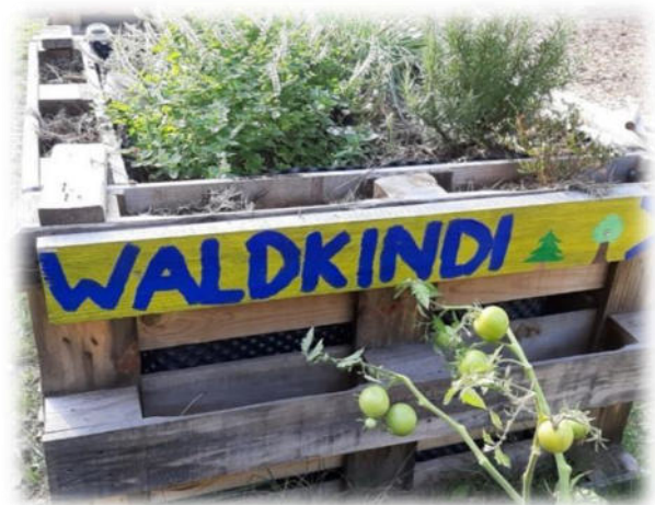
Abbildung 48: co.natur gGmbH Waldkindergarten Weil der Stadt

Die Kinder nutzen im Kindergartenalltag oft informelle Wege, um ihre Unzufriedenheit zu äußern. Sie äußern ihre Beschwerde nicht immer eindeutig und direkt. Dabei müssen sie sicher sein, dass ihre Anliegen ernst genommen werden. Auf die Festlegung einer "Beschwerdestelle" oder eines starren Verfahrens haben wir ganz bewusst verzichtet. Unsere Erfahrung ist, dass sich die Kinder in aller Regel an Mitarbeitende ihres Vertrauens wenden, wenn sie Anliegen haben und sich besprechen wollen. Diese selbstgewählte Person des Vertrauens steht den Kindern im Alltag unmittelbar zur Verfügung und ist sozusagen die erste, entscheidende Beschwerdestelle.