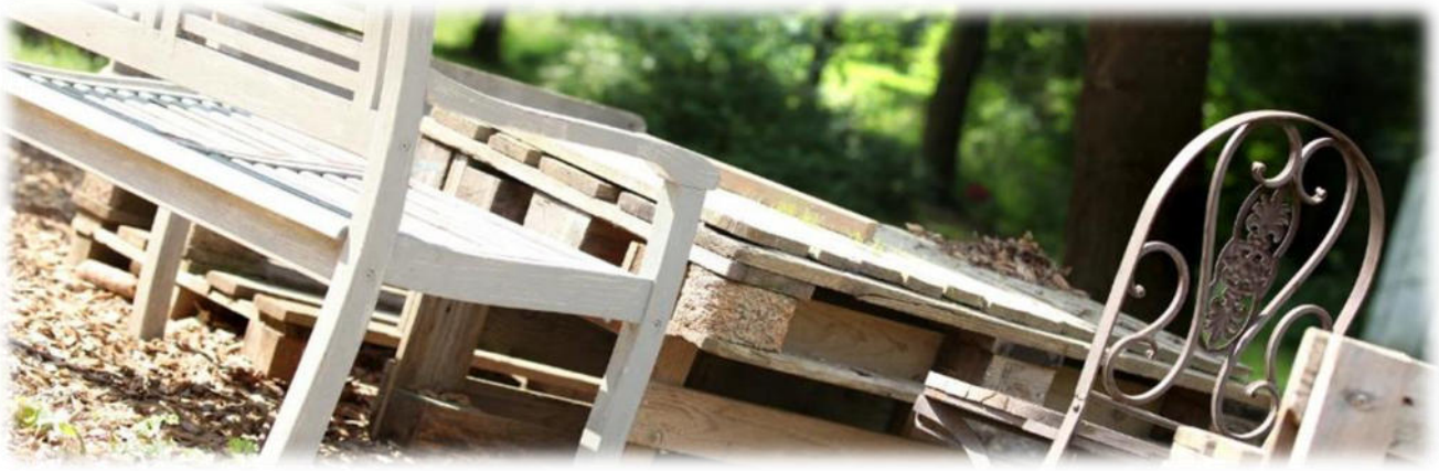
Abbildung 14: co.natur gGmbH Waldkindergarten Heimsheim