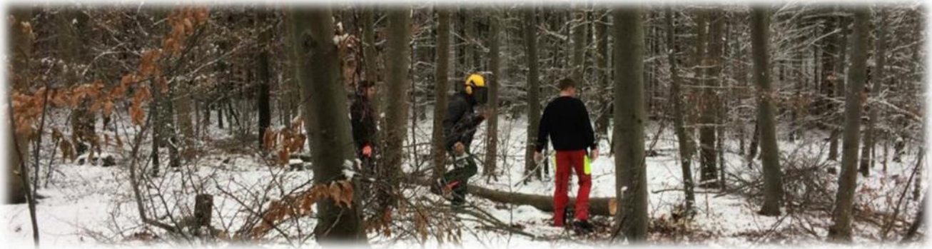
Abbildung 7: co.natur gGmbH Waldkindergarten Heimsheim

Das Wetter kann immer wieder zu einer Gefahr werden. Allgemein ist es immer wichtig, dem Wetter entsprechend gekleidet zu sein. Regenkleidung und Wechselkleidung ist immer vorhanden.