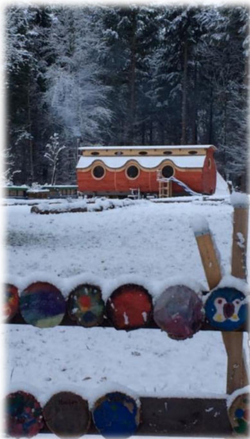
Abbildung 1: co.natur gGmbH Waldkindergarten Heimsheim