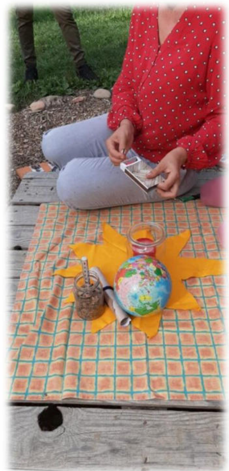
Abbildung 36: co.natur gGmbH Waldkindergarten Heimsheim

Wichtig hierbei ist nur die Art und Weise, diese Fehler zu betrachten, zu bewerten und damit umzugehen. Um einen konstruktiven Umgang mit Fehlern gewährleisten zu können, müssen sie offen benannt, eingestanden und aufgearbeitet werden und können so zur Verbesserung unserer Arbeit führen. Fehlverhalten oder Sachverhalte, deren Sinn und Hintergrund nicht verstanden werden, sprechen unsere Mitarbeitenden offen bei Kollegen und Kolleginnen, im Team und gegenüber Leitungen und Geschäftsleitung an. Es ist uns wichtig, dass unsere Mitarbeitenden auf ihre physischen und psychischen Grenzen achten, gesundheitliche Beeinträchtigungen ernst nehmen und sich bei Bedarf rechtzeitig Hilfe holen.