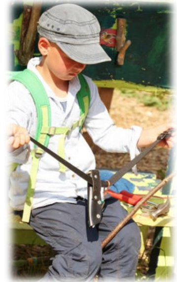
Abbildung 32: co.natur gGmbH Waldkindergarten Heimsheim