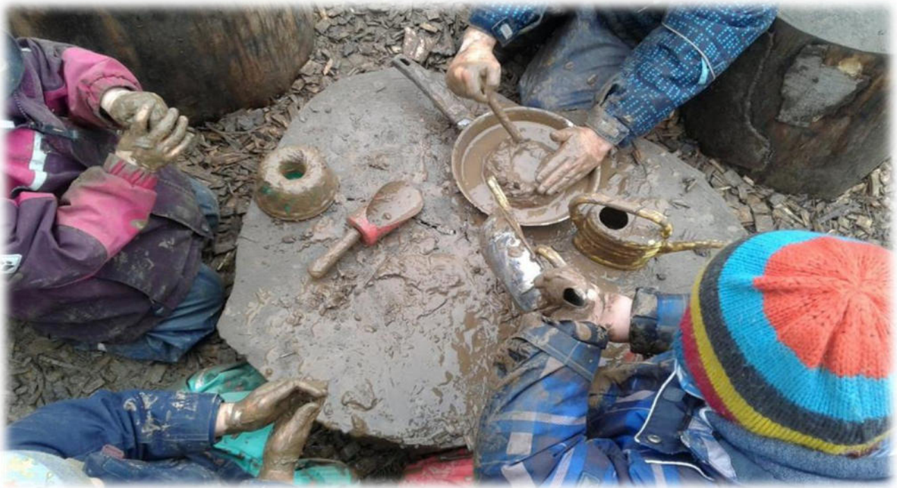
Abbildung 27: co. natur gGmbH Waldkindergarten Heimsheim

Der Spracherwerb gilt als Schlüsselkompetenz, denn durch Sprache eröffnen sich den Kindern weitere Entwicklungsfelder. Grundlegende Voraussetzung für den Spracherwerb ist das genaue Zuhören. Die Stille des Waldes bietet beste Voraussetzungen dafür. Zudem beeinflusst das Spielen mit Naturmaterialien die Sprachentwicklung positiv. Wenn ein Kind seinem Spielpartner erklären muss, ob sein Stock ein Zauberstab oder eine Lanze ist, fördert das automatisch seine Sprachentwicklung.