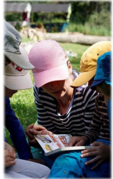
Abbildung 13: co.natur gGmbH Waldkindergarten Heimsheim

Es sind jeden Tag, während der gesamten Öffnungszeiten, mindestens 2 Personen zeitgleich vor Ort (wovon mindestens eine davon eine Fachkraft ist). In der Kernzeit von 8.30 Uhr bis 12.30 Uhr sind mindestens 3 Mitarbeitende zeitgleich im Wald eingesetzt, wovon mindestens einer davon eine Fachkraft ist. Im Rahmen der finanziellen und organisatorischen Möglichkeiten sichern wir die regelmäßige Anwesenheit von 3 - 5 Personen. Vertretungen aufgrund von Krankheit, Fortbildung, etc. werden durch die Flexibilität von Teilzeit-Angestellten und durch ehrenamtliche Mithilfe von Eltern sichergestellt. Unsere pädagogischen Fachkräfte können verlässliche Bindungen schaffen und steht mit Angeboten sowie Rat und Tat an der Seite der Kinder und Eltern. Im Tagesablauf des Kindergartens bieten unsere Fachkräfte den Kindern Bastel-, Mal-, Bau- und Werkangebote zu den jeweils aktuellen Jahreszeiten an sowie entsprechende musikalische Angebote. Sie beobachten die Kinder oder spielen mit. Sie pflegen den persönlichen Kontakt und geben Impulse für Freispielideen. Sie haben die Übersicht über alle Kinder, dokumentieren und beobachten und sind Ansprechpartner bzw. Ansprechpartnerinnen für Eltern und Kinder.