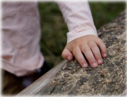
Abbildung 15: co.natur gGmbH Waldkindergarten Heimsheim

Sie sind ein wichtiger und wertvoller Teil der Gemeinschaft und haben dieselben Rechte, wie die Erwachsenen. Kinder wollen dazugehören und sie wollen wachsen. Sie haben Stärken und Schwächen, diese dürfen und sollen gelebt und gezeigt werden dürfen.