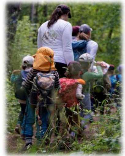
Abbildung 35: co.natur gGmbH Waldkindergarten Heimsheim

Unsere Mitarbeitenden nehmen aktiv Stellung gegen diskriminierendes, gewalttätiges und sexistisches Verhalten und greifen in solchen Fällen auch sofort ein. Wenn die Mitarbeitenden Kenntnis von einem Sachverhalt erhalten, der die Vermutung auf ein Fehlverhalten durch einen Mitarbeitenden nahelegt, wird dies umgehend dem unmittelbaren Vorgesetzten als auch der Geschäftsführung mitgeteilt. Das pädagogische Handeln unserer Mitarbeitenden ist transparent und nachvollziehbar und entspricht fachlichen Standards. Es werden vorhandene Strukturen und Abläufe eingehalten und dokumentiert. Dabei wird sich nach den Bedürfnissen der Kinder gerichtet und mit den Eltern bzw. Sorgeberechtigten kollegial und transparent zusammengearbeitet.