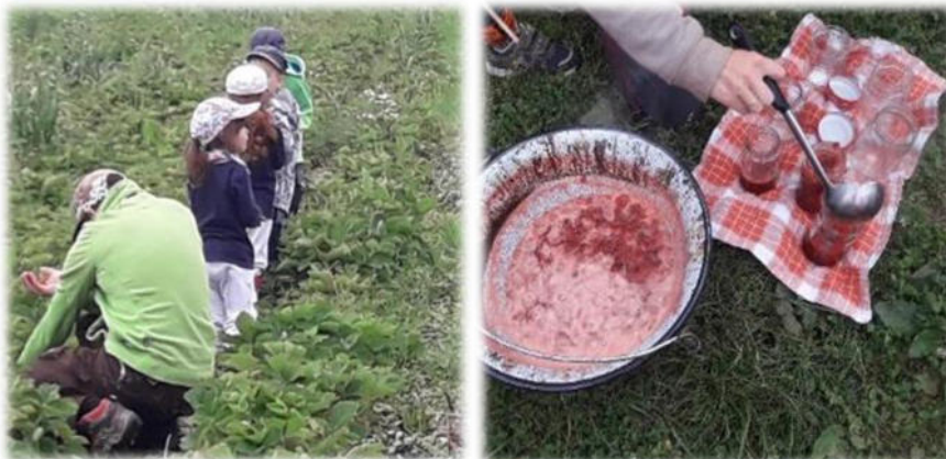
Abbildung 21: co.natur gGmbH Waldkindergarten Heimsheim

Arbeitsprozesse werden nach Möglichkeit in den Außenbereich verlagert, sodass ein ausgewogenes Verhältnis zwischen Tätigkeiten im Innen- und Außenbereich besteht. [...] Dieser Anspruch wird von den Waldkindergärten weitestgehend realisiert. Objekt- und kulturgebundene Innenraumtätigkeiten lernt das Waldkindergartenkind ohnehin in der verbleibenden Familienzeit kennen [...] Auf Lob wird weitestgehend verzichtet. [...]