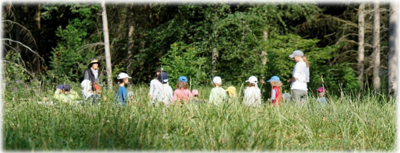
Abbildung 3: co.natur gGmbH Waldkindergarten Heimsheim

Gerade in einer Gesellschaft, in der viel über Mobbing, Cyber-Mobbing, Burn-Out, ADHS und Depressionen gesprochen wird, ist es wichtig, dass Kinder schon ganz früh Ressourcen nicht nur theoretisch lernen - sondern verinnerlichen und trainieren: Wie gehe ich mit den Gefühlen Wut, Frustration, Angst oder Traurigkeit um. Der Wald bietet hier viele Möglichkeiten.