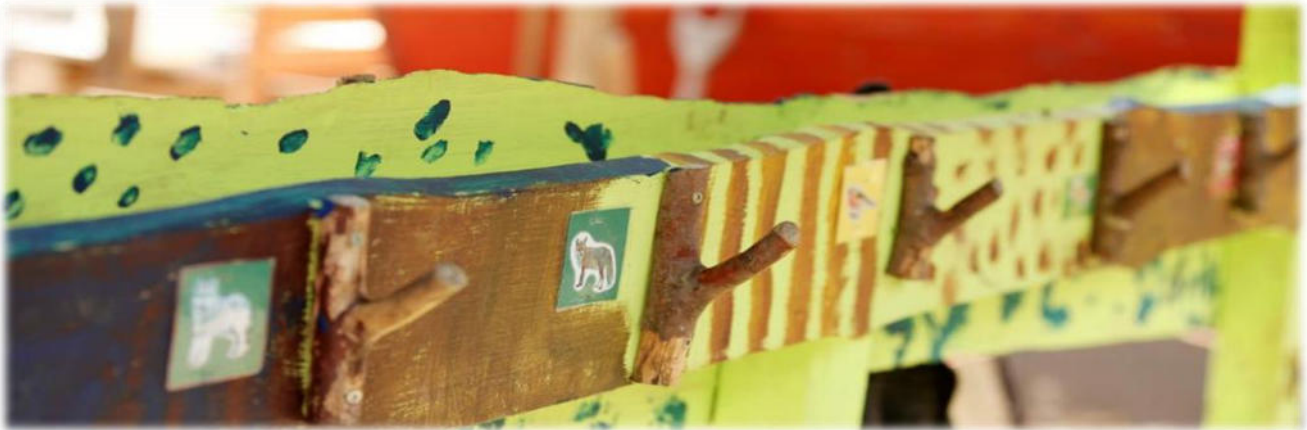
Abbildung 28: co.natur gGmbH Waldkindergarten Heimsheim

Die Eingewöhnung eines neuen Kindes erfolgt in Absprache mit den pädagogischen Fachkräften und ist individuell. Eine Fachkraft übernimmt die Eingewöhnung eines Kindes und geht eine vertrauensvolle Beziehung mit dem Kind ein. Nur ein Kind, das sich sicher und wohlfühlt, kann sich entspannt von den Eltern lösen und sich auf den Kindergarten freuen. Es braucht auch die Bereitschaft der Eltern, sich von ihrem Kind zu lösen, um ihm einen guten Start im Kindergarten zu ermöglichen. Daher legen wir bei der Eingewöhnung auch Wert darauf, dass die Eltern sich wohlfühlen.