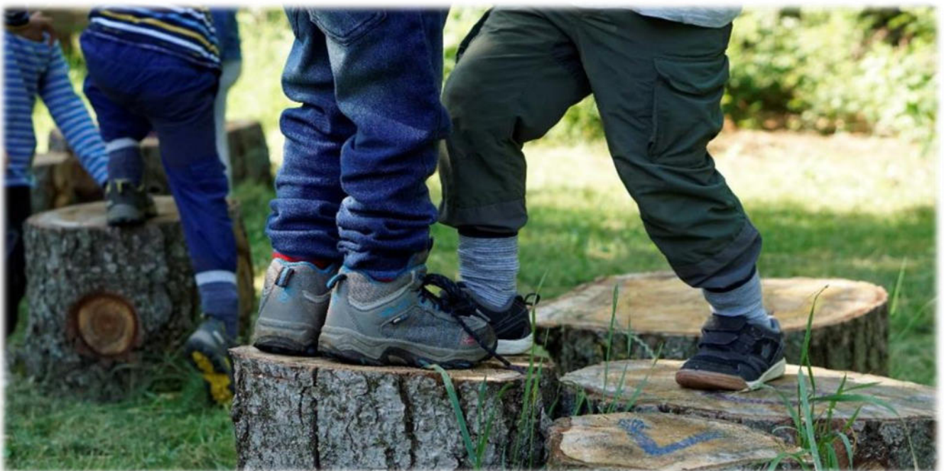
Abbildung 24: co.natur gGmbH Waldkindergarten Heimsheim

Während dem Freispiel wird die Selbständigkeit der Kinder gefördert, denn sie müssen entscheiden, wo, was und mit wem sie spielen wollen. Die Kinder erleben sich als autonom (sie entscheiden selbst, kein Erwachsener entscheidet für sie). Sie können spielerisch die Sprache lernen, sich ausprobieren, neue Spiele kennenlernen und in ihrer eigenen Welt versinken. Außerdem wird die Motorik gefördert und die Fantasie angeregt.