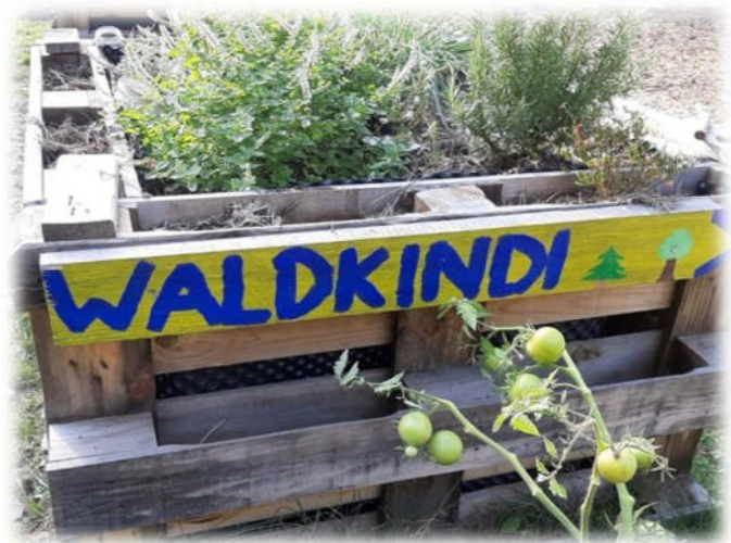
Abbildung 37: co.natur gGmbH Waldkindergarten Weil der Stadt

Die Kinder nutzen im Kindergartenalltag oft informelle Wege, um ihre Unzufriedenheit zu äußern. Sie äußern ihre Beschwerde nicht immer eindeutig und direkt. Dabei müssen sie sicher sein, dass ihre Anliegen ernst genommen werden. Auf die Festlegung einer "Beschwerdestelle" oder eines starren Verfahrens haben wir ganz bewusst verzichtet. Unsere Erfahrung ist, dass sich die Kinder in aller Regel an Mitarbeitende ihres Vertrauens wenden, wenn sie Anliegen haben und sich besprechen wollen.