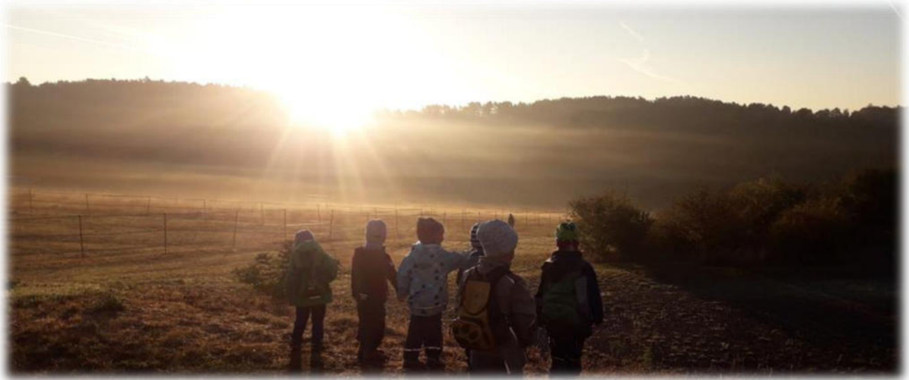
Abbildung 9: co.natur gGmbH Waldkindergarten Heimsheim