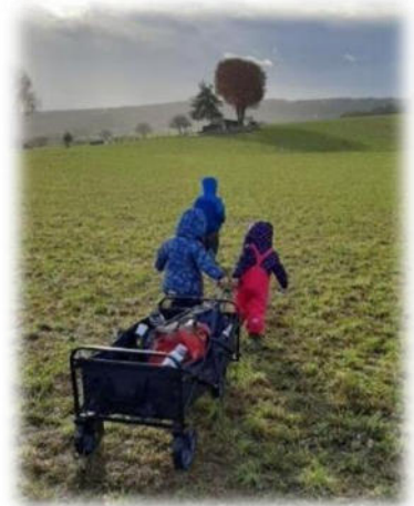
Abbildung 10: co.natur gGmbH Waldkindergarten Heimsheim

Ab 7:30 Uhr bis 8:30 Uhr ist die offizielle Bringzeit der Kinder an den Kindergarten. Hier werden die Kinder in Empfang genommen und begrüßt. Darauf folgt das Ankommen und Freispielzeit bis zum Morgenkreis. Um 8.30 Uhr beginnt der Morgenkreis. Hier werden Begrüßungslieder gesungen, die anwesenden Kinder und Betreuungspersonen gezählt und gemeinsam überlegt, welche Kinder fehlen und der Tagesplan mit den Kindern gemeinsam besprochen und abgestimmt. Die Gruppe geht dann im Anschluss auf Expedition in den Wald. Ggf. kann es auch Aktionen am Bauwagenplatz geben, wie z.B. Vorschule, Essenszubereitung oder Freispiel. Gegen 10Uhr wird gemeinsam mit den Kindern gevespert. Zwischen 12.30 Uhr und 13.30 Uhr können die Kinder am Bauwagen abgeholt werden. Die Betreuungspersonen haben dann auch Zeit für Tür- und Angelgespräche.