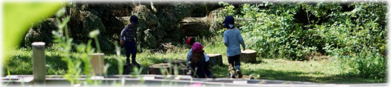
Abbildung 16: co.natur gGmbH Waldkindergarten Heimsheim