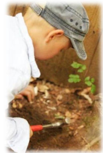
Abbildung 19: co.natur gGmbH Waldkindergarten Heimsheim