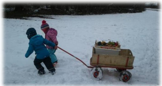
Abbildung 8: co.natur gGmbH Waldkindergarten Heimsheim

Im Winter kann es sehr kalt werden. Dann wird auf warme Kleidung (und zusätzlich Handschuhe und Mütze) geachtet sowie auf Aufwärm- und Bewegungsmöglichkeiten der Kinder, z.B. im Bauwagen. Außerdem ist es empfehlenswert, dass die Kinder warmes Vesper und Tee in Thermobehälter mitbringen.