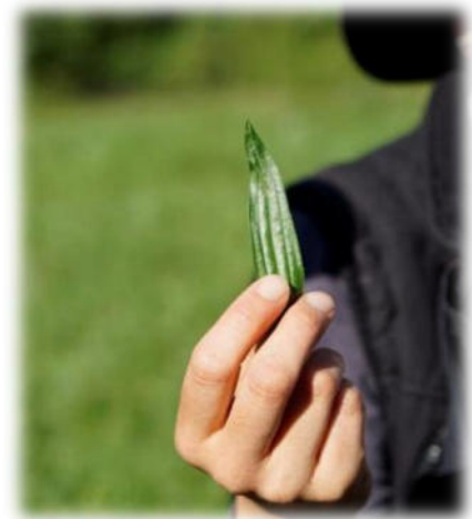
Abbildung 23: co.natur gGmbH Waldkindergarten Heimsheim

„Alles zu seiner Zeit“? Ja, bitte! Was wollen Eltern einem Schulkind noch bieten, das durch eben solche Vorwegnahmen nur desinteressiert antworten kann: „Alter Hut, das kenn' ich schon!“ Auf der Strecke bleibt das Wissen und die Behauptung stiftende Kenntnis des näheren Wohnumfeldes und deren Flora und Fauna mit der Chance, hier lebenspraktisch tätig werden zu können. Ich habe als Kind im Sommer Kamille sammeln dürfen bzw. müssen. Ohne dass das Beutelchen voll war, brauchte ich nicht heimzukommen. Ich wusste um die Sinnhaftigkeit, Notwendigkeit meines Tuns. Ich war eingebunden in nützliche, weil notwendige Tätigkeitsabläufe. Viele standen im Zusammenhang mit einer bestimmten Jahreszeit. Die Natur gab ein Zeitfenster vor, das genutzt werden musste. Und die Eltern hielten mich dazu an. Und so ganz nebenbei lernte ich die Namen von Pflanzen - hier Heilkräutern - und deren wohltuende Wirkung auf den menschlichen Organismus.