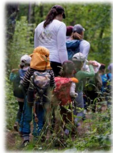
Abbildung 35: co.natur gGmbH Waldkindergarten Heimsheim

Unsere Mitarbeitenden nehmen aktiv Stellung gegen diskriminierendes, gewalttätiges und sexistisches Verhalten und greifen in solchen Fällen auch sofort ein. Wenn die Mitarbeitenden Kenntnis von einem Sachverhalt erhalten, der die Vermutung auf ein Fehlverhalten durch einen Mitarbeitenden nahelegt, wird dies umgehend dem unmittelbaren Vorgesetzten als auch der Geschäftsführung mitgeteilt. Das pädagogische Handeln unserer Mitarbeitenden ist transparent und nachvollziehbar und entspricht fachlichen Standards. Es werden vorhandene Strukturen und Abläufe eingehalten und dokumentiert. Dabei wird sich nach den Bedürfnissen der Kinder gerichtet und mit den Eltern bzw. Sorgeberechtigten kollegial und transparent zusammengearbeitet.