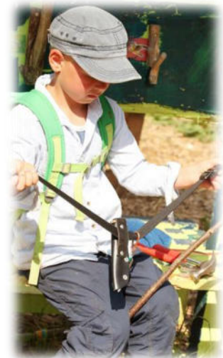
Abbildung 32: co.natur gGmbH Waldkindergarten Heimsheim