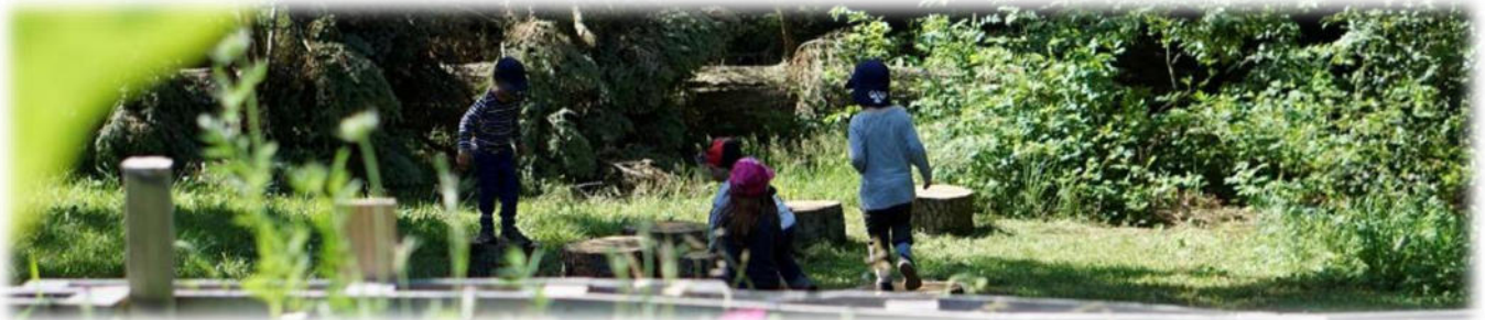
Abbildung 16: co.natur gGmbH Waldkindergarten Heimsheim