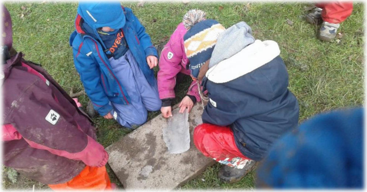
Abbildung 29: co.natur gGmbH Waldkindergarten Heimsheim

Diese Beobachtungsdokumentationen werden im Sozialdatenschutz vertraulich behandelt.