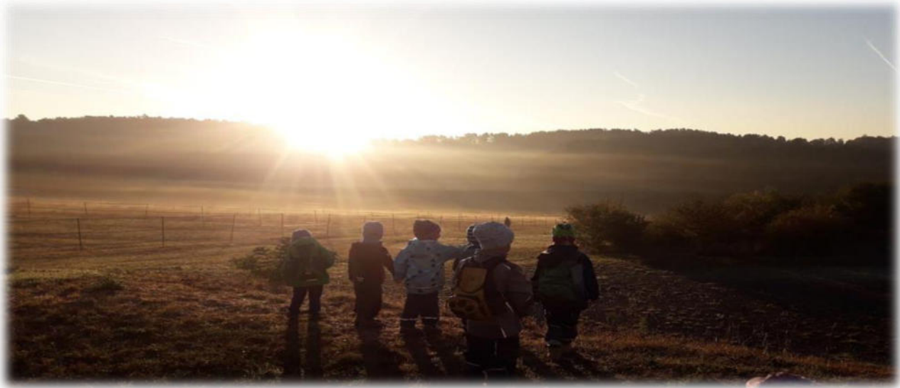
Abbildung 9: co.natur gGmbH Waldkindergarten Heimsheim