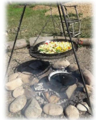
Abbildung 18: co.natur gGmbH Waldkindergarten Heimsheim

Wir vertreten die Ansicht, dass Kinder, denen man viel zutraut und die viele praktische Dinge lernen dürfen, ein starkes Selbstwertgefühl entwickeln und sich selbst vieles zutrauen.