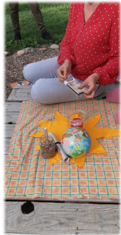
Abbildung 36: co.natur gGmbH Waldkindergarten Heimsheim

Wichtig hierbei ist nur die Art und Weise, diese Fehler zu betrachten, zu bewerten und damit umzugehen. Um einen konstruktiven Umgang mit Fehlern gewährleisten zu können, müssen sie offen benannt, eingestanden und aufgearbeitet werden und können so zur Verbesserung unserer Arbeit führen. Fehlverhalten oder Sachverhalte, deren Sinn und Hintergrund nicht verstanden werden, sprechen unsere Mitarbeitenden offen bei Kollegen und Kolleginnen, im Team und gegenüber Leitungen und Geschäftsleitung an. Es ist uns wichtig, dass unsere Mitarbeitenden auf ihre physischen und psychischen Grenzen achten, gesundheitliche Beeinträchtigungen ernst nehmen und sich bei Bedarf rechtzeitig Hilfe holen.