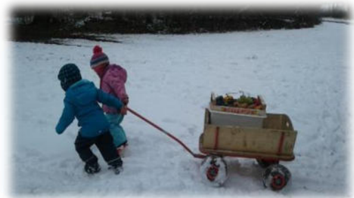
Abbildung 8: co.natur gGmbH Waldkindergarten Heimsheim

Außerdem ist es empfehlenswert, dass die Kinder warme Vesper und Tee in Thermobehälter mitbringen.