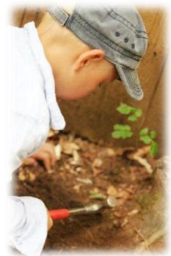
Abbildung 19: co.natur gGmbH Waldkindergarten Heimsheim