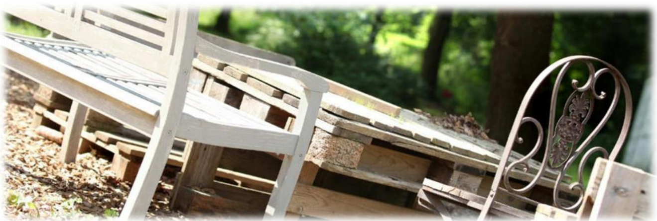
Abbildung 14: co.natur gGmbH Waldkindergarten Heimsheim

Die pädagogischen Fachkräfte müssen alle 2 Jahre einen Erste-Hilfe-Kurs absolvieren, die Infektionsschutzbelehrung vom Gesundheitsamt besuchen und alle 2 Jahre nachgeschult werden.