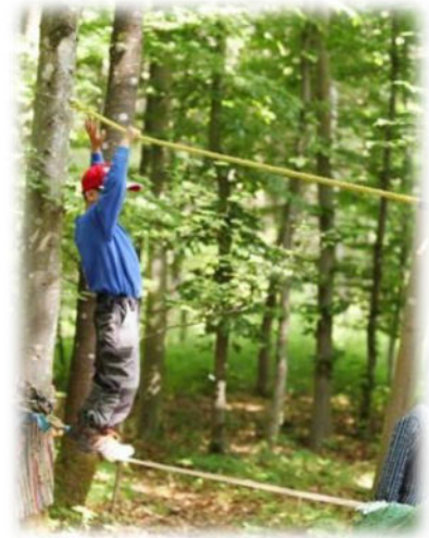
Abbildung 4: co.natur gGmbH Waldkindergarten Heimsheim

Die Kinder im Waldkindergarten erlernen den Umgang mit Tieren, lernen die Zusammenhänge von Natur und Leben kennen, entwickeln einen emotionalen Bezug und eine Bindung zur Natur, bestaunen und wertschätzen sie, öffnen ihren Blick für die Eigenarten und Wunder der Natur und nehmen die natürlichen Rhythmen wahr: Jahreszeiten, Temperaturen, Wetter, Tageszeiten und den Jahreskreislauf.