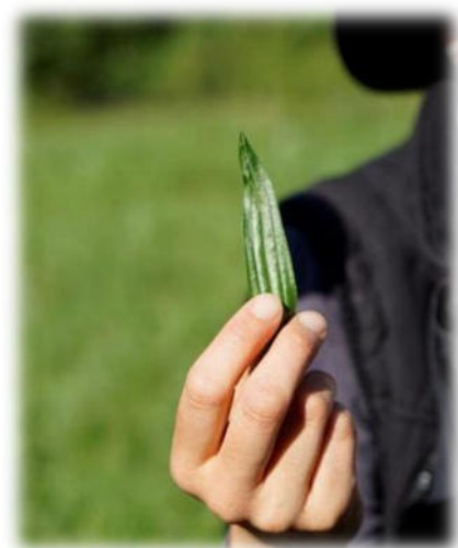
Abbildung 23: co.natur gGmbH Waldkindergarten Heimsheim

„Alles zu seiner Zeit“? Ja, bitte! Was wollen Eltern einem Schulkind noch bieten, das durch eben solche Vorwegnahmen nur desinteressiert antworten kann: „Alter Hut, das kenn' ich schon!“ Auf der Strecke bleibt das Wissen und die Beheimatung stiftende Kenntnis des näheren Wohnumfeldes und deren Flora und Fauna mit der Chance, hier lebenspraktisch tätig werden zu können. Ich habe als Kind im Sommer Kamille sammeln dürfen bzw. müssen. Ohne dass das Beutelchen voll war, brauchte ich nicht heimzukommen. Ich wusste um die Sinnhaftigkeit, Notwendigkeit meines Tuns. Ich war eingebunden in nützliche, weil notwendige Tätigkeitsabläufe. Viele standen im Zusammenhang mit einer bestimmten Jahreszeit. Die Natur gab ein Zeitfenster vor, das genutzt werden musste. Und die Eltern hielten mich dazu an. Und so ganz nebenbei lernte ich die Namen von Pflanzen - hier Heilkräutern - und deren wohltuende Wirkung auf den menschlichen Organismus.