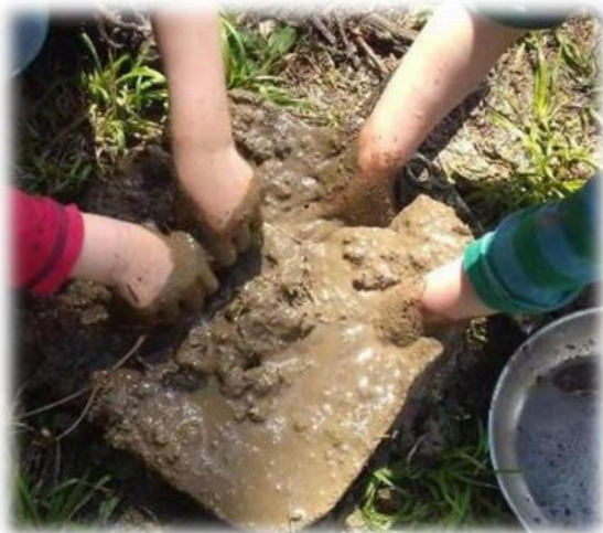
Abbildung 20: co.natur gGmbH Waldkindergarten Heimsheim

Wenn wir unsere Kinder ernst nehmen, dann sollten wir sie an der realen, ernsthaften Lebenswirklichkeit teilhaben lassen. Und da sind es vor allem die alltagstauglichen Fertigkeiten, die zählen: Arbeiten, die Tag für Tag in der Lebensgemeinschaft Familie oder in einer Kindertageseinrichtung anfallen, die getan werden müssen, um die Versorgung dieser Gemeinschaft zu gewährleisten. Dabei eröffnet sich ein Betätigungsfeld, das weit über die Nahrungszubereitung hinausgeht.