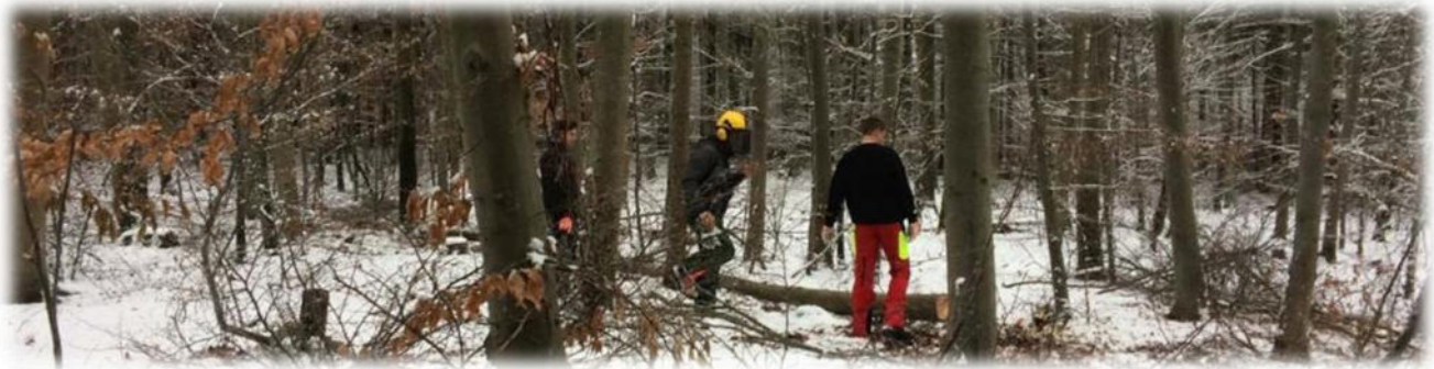
Abbildung 7: co.natur gGmbH Waldkindergarten Heimsheim

Das Wetter kann immer wieder zu einer Gefahr werden. Allgemein ist es immer wichtig, dem Wetter entsprechend gekleidet zu sein. Regenkleidung und Wechselkleidung ist immer vorhanden.