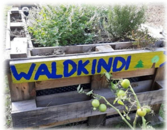
Abbildung 37: co.natur gGmbH Waldkindergarten Weil der Stadt

Kinder äußern ihre Beschwerden oft nicht direkt. Ihre Anliegen und Bedürfnisse, die hinter einer Beschwerde im weitesten Sinne liegen, können sehr unterschiedlich aussehen. Dies kann ein Unwohlsein, eine Unzufriedenheit sein (z. B. mit dem Essen), es kann sich um einen Veränderungswunsch handeln (z. B. bezüglich einer Gruppenregel) oder ein Thema betreffen, das sich aus dem Verhalten und den Reaktionen anderer ergibt (z. B. dem Konflikt, nicht mitspielen zu dürfen). Unsere Mitarbeitenden sind gefordert, die Unmutsbekundungen der Kinder bewusst wahrzunehmen und sich mit ihnen auf die Suche nach dem zu begeben, was hinter der Beschwerde steckt. Deshalb spielen alle Anliegen