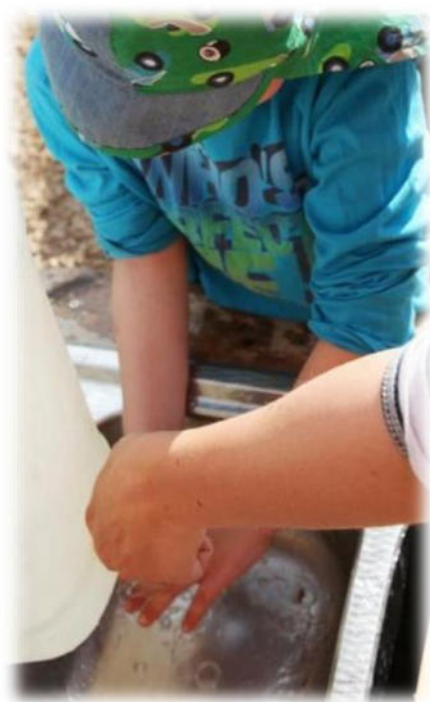
Abbildung 5: co.natur gGmbH Waldkindergarten Heimsheim

Nach jedem Toilettengang und vor dem Essen ist eine gründliche Reinigung der Hände mit Wasser und Seife notwendig. Die Kinder reinigen die Hände mit mitgebrachtem Wasser (Trinkwasserqualität) und pH-neutraler, abbaubarer Flüssigseife (die Bodenbelastung durch die Flüssigseife ist vernachlässigbar). Pro Person haben wir eine Wassermenge von ca. 500 ml dabei. Der Wasserkanister wird täglich neu mit Trinkwasser befüllt. 2 Kanister werden immer abwechselnd benutzt, um ein zwischenzeitliches komplettes Trocknen zu gewährleisten und damit der Biofilmbildung vorzubeugen. Der Kanister steht im Schatten und damit tagsüber vor direkter Sonneneinstrahlung geschützt, um eine Keimvermehrung zu verhindern. Am Ende des Arbeitstages wird der Kanister vollständig zu entleert und getrocknet. Der Kanister ist für Lebensmittel geeignet und im Winter ist er durch einen Thermobehälter gegen Frost geschützt. Das Wasser aus diesem Kanister wird nur für die Händehygiene verwendet. Zur Händetrocknung hat jedes Kind ein eigenes Stoffhandtuch dabei, das täglich gewechselt wird.