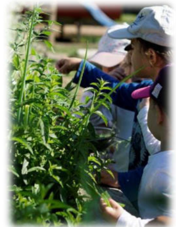
Abbildung 5: co.natur gGmbH Waldkindergarten Heimsheim