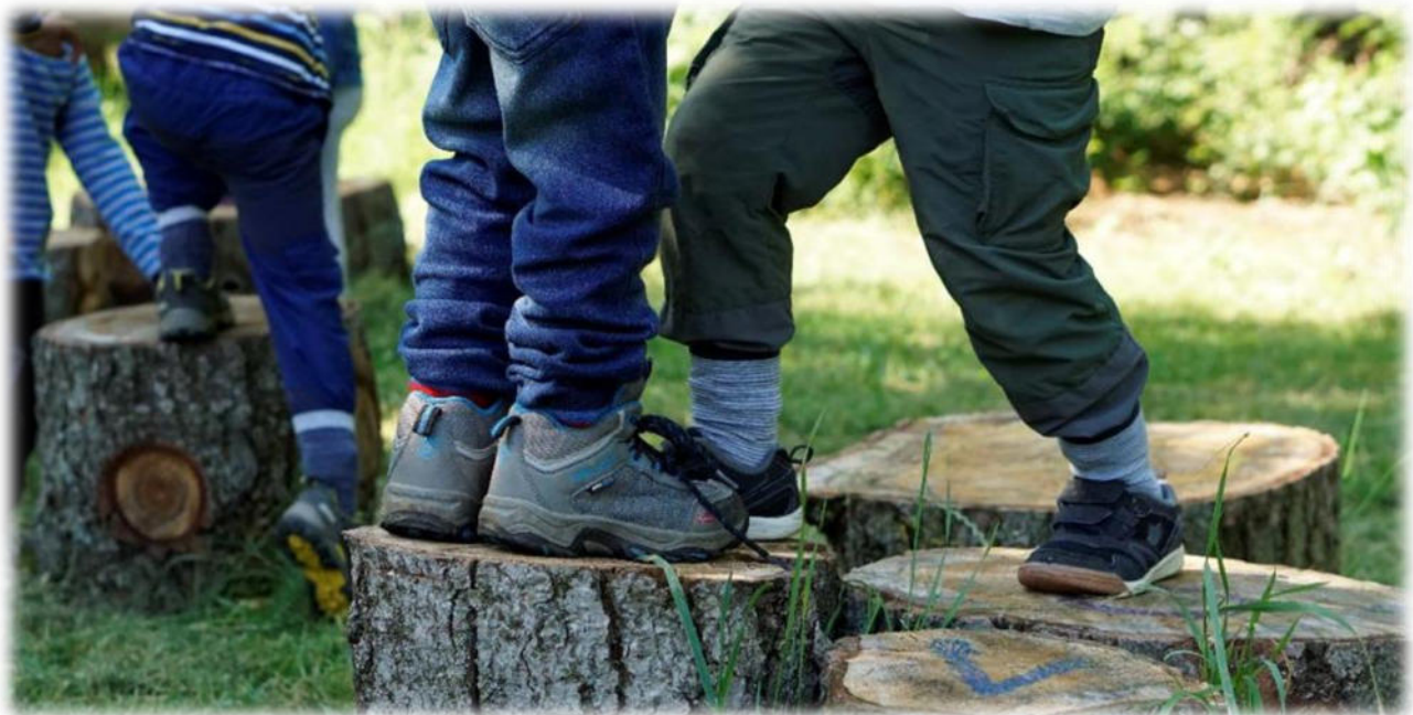
Abbildung 24: co.natur gGmbH Waldkindergarten Heimsheim

Während dem Freispiel wird die Selbständigkeit der Kinder gefördert, denn sie müssen entscheiden, wo, was und mit wem sie spielen wollen. Die Kinder erleben sich als autonom (sie entscheiden selbst, kein Erwachsener entscheidet für sie). Sie können spielerisch die Sprache lernen, sich ausprobieren, neue Spiele kennenlernen und in ihrer eigenen Welt versinken. Außerdem wird die Motorik gefordert und gefördert und die Fantasie angeregt.