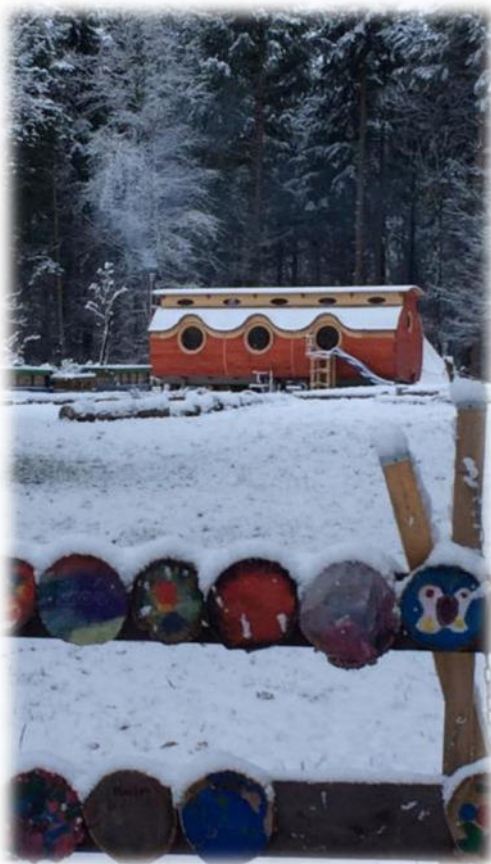
Abbildung 1: co.natur gGmbH Waldkindergarten Heimsheim