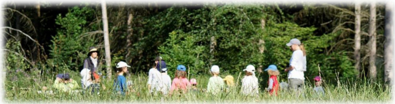
Abbildung 3: co.natur gGmbH Waldkindergarten Heimsheim

Gerade in einer Gesellschaft, in der viel über Mobbing, Cyber-Mobbing, Burn-Out, ADHS und Depressionen gesprochen wird, ist es wichtig, dass Kinder schon ganz früh Ressourcen nicht nur theoretisch lernen - sondern verinnerlichen und trainieren: Wie gehe ich mit den Gefühlen Wut, Frustration, Angst oder Traurigkeit um. Der Wald bietet hier viele Möglichkeiten.