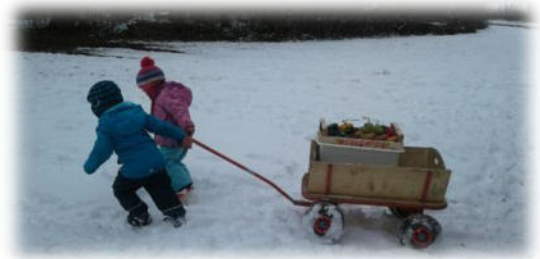
Abbildung 8: co.natur gGmbH Waldkindergarten Heimsheim

Im Winter kann es sehr kalt werden. Dann wird auf warme Kleidung (und zusätzlich Handschuhe und Mütze) geachtet sowie auf Aufwärm- und Bewegungsmöglichkeiten der Kinder, z.B. im Bauwagen. Außerdem ist es empfehlenswert, dass die Kinder warmes Vesper und Tee in Thermobehälter mitbringen.