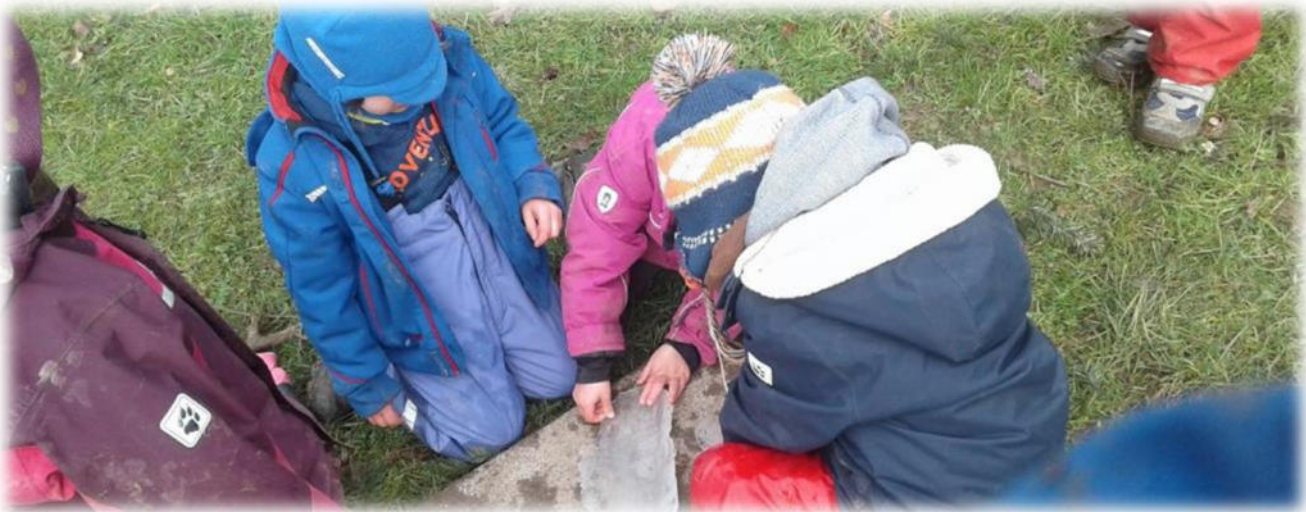
Abbildung 29: co.natur gGmbH Waldkindergarten Heimsheim

Ein wichtiger Bestandteil unserer pädagogischen Arbeit ist das Dokumentieren von Beobachtungen. In regelmäßigen Abständen wird der Lern- und Entwicklungsstand eines jeden Kindes schriftlich festgehalten. Unsere Beobachtungen halten wir anhand mehrerer Beobachtungsbögen fest. Diese beinhalten das Sprachverhalten und das Sprachverständnis, die kognitive Entwicklung, das Spiel-, Lern- und Sozialverhalten, die Wahrnehmung und Orientierung sowie die Motorik.