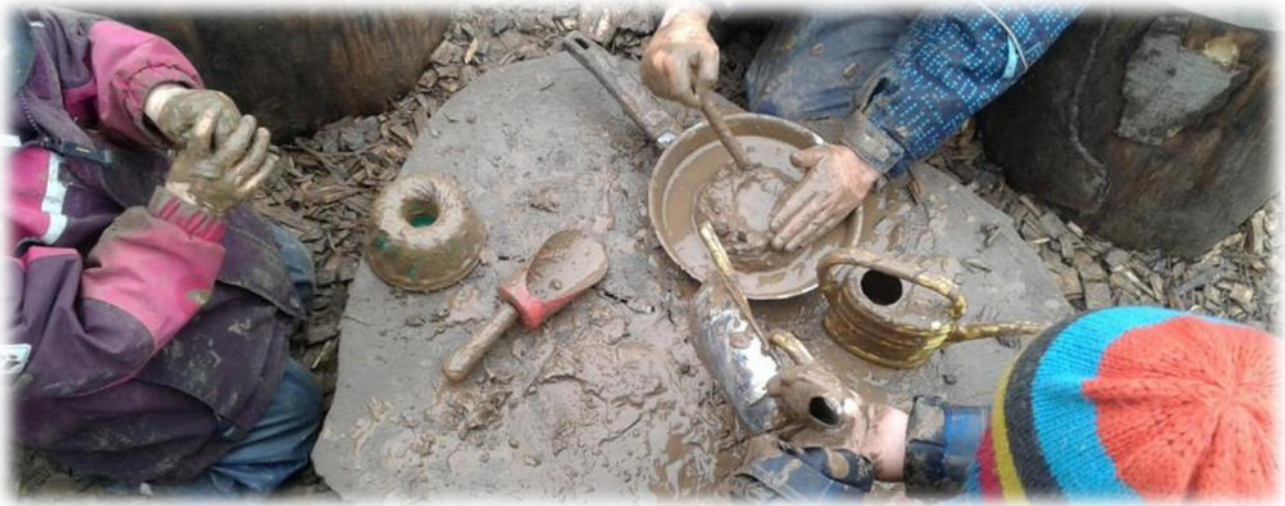
Abbildung 26: co.natur gGmbH Waldkindergarten Heimsheim