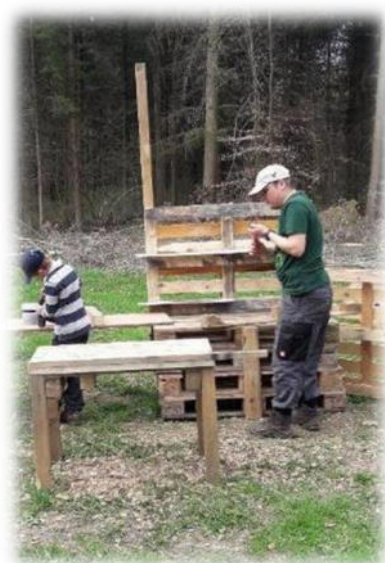
Abbildung 34: co.natur gGmbH Waldkindergarten Heimsheim

Nur mit der aktiven Mitarbeit von Eltern ist es möglich, den Waldkindergarten aufrechtzuerhalten. Eltern sind aber auch Vorbild und leben einen Gemeinschaftssinn vor. Die aktive Mitarbeit von Eltern ist wichtig für die Öffentlichkeitsarbeit, spart Geld für Neuanschaffungen, sorgt für ein Gefühl der Gemeinschaft und macht zudem noch Spaß.