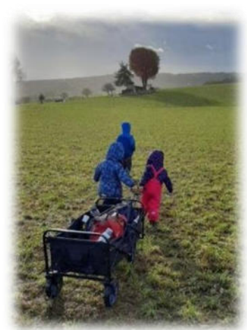
Abbildung 1: co.natur gGmbH Waldkindergarten Heimsheim

Es gibt in Heimsheim zwei Waldgrundstücke (der Wichtelplatz und der Schmetterlingsplatz) an dem man sich auch aufhalten kann. Ein Platz ist mit einem Unterschlupf ausgestattet, sodass man auch bei Regen dort Schutz finden kann. Was Spielzeug betrifft, haben wir im Waldkindergarten die Devise "weniger ist mehr". In den Wägen sind jedoch Bücher, Stifte, Papier, Scheren und Klebstoff vorhanden.