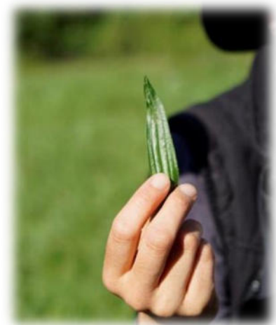
Abbildung 23: co.natur gGmbH Waldkindergarten Heimsheim

„Alles zu seiner Zeit“? Ja, bitte! Was wollen Eltern einem Schulkind noch bieten, das durch eben solche Vorwegnahmen nur desinteressiert antworten kann: „Alter Hut, das kenn' ich schon!“ Auf der Strecke bleibt das Wissen und die Beheimatung stiftende Kenntnis des näheren Wohnumfeldes und deren Flora und Fauna mit der Chance, hier lebenspraktisch tätig werden zu können. Ich habe als Kind im Sommer Kamille sammeln dürfen bzw. müssen. Ohne dass das Beutelchen voll war, brauchte ich nicht heimzukommen. Ich wusste um die Sinnhaftigkeit, Notwendigkeit meines Tuns. Ich war eingebunden in nützliche, weil notwendige Tätigkeitsabläufe. Viele standen im Zusammenhang mit einer bestimmten Jahreszeit. Die Natur gab ein Zeitfenster vor, das genutzt werden musste. Und die Eltern hielten mich dazu an. Und so ganz nebenbei lernte ich die Namen von Pflanzen - hier Heilkräutern - und deren wohltuende Wirkung auf den menschlichen Organismus.