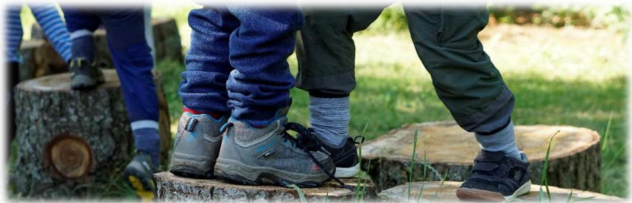
Abbildung 24: co.natur gGmbH Waldkindergarten Heimsheim

Freispiel ist spielen lassen unter Aufsicht. Es ist ein komplexes Geschehen während einer bestimmten Zeitdauer, dass sich jedes Mal neu aus spontanem Tätigwerden der Kinder und Zurückhaltung der pädagogischen Fachkräfte entwickelt. Das Freispiel ist vollkommen frei. Die Kinder können spielen, mit wem und was sie wollen.