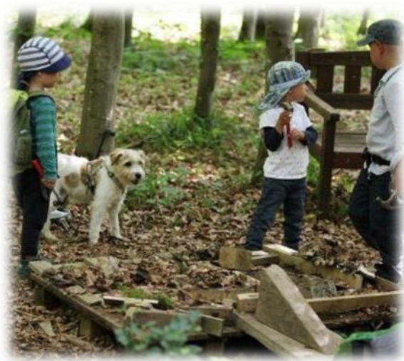
Abbildung 25: co.natur gGmbH Waldkindergarten Heimsheim

Kinder haben einen Willen, dieser Wille soll und darf geäußert werden und wir achten darauf, diesem nach Möglichkeit auch nachzukommen. Alle Kinder haben das Recht ihre Meinung zu sagen und diese wird respektiert.