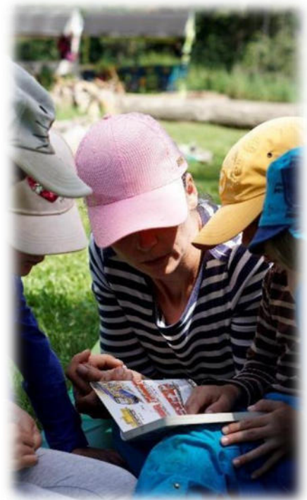
Abbildung 13: co.natur gGmbH Waldkindergarten Heimsheim

Unsere pädagogischen Fachkräfte können verlässliche Bindungen schaffen und steht mit Angeboten sowie Rat und Tat an der Seite der Kinder und Eltern. Im Tagesablauf des Kindergartens bieten unsere Fachkräfte den Kindern Bastel-, Mal-, Bau- und Werkangebote zu den jeweils aktuellen Jahreszeiten an sowie entsprechende musikalische Angebote. Sie beobachten die Kinder oder spielen mit. Sie pflegen den persönlichen Kontakt und geben Impulse für Freispielideen. Sie haben die Übersicht über alle Kinder, dokumentieren und beobachten und sind Ansprechpartner bzw. Ansprechpartnerinnen für Eltern und Kinder.