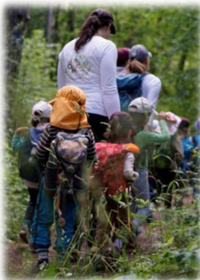
Abbildung 35: co.natur gGmbH Waldkindergarten Heimsheim

Unser höchstes Anliegen ist es, Kinder in ihren Rechten zu stärken und sie so vor körperlichen und seelischen Verletzungen zu schützen. Die uns anvertrauten Kinder haben ein Recht auf eine „sichere“ Einrichtung. Aus diesem Grund werden unsere Mitarbeitenden weder offene noch subtile Formen von Gewalt, Grenzverletzungen oder Übergriffe an den Kindern vornehmen bzw. wissentlich zulassen oder dulden, wie z. B.: