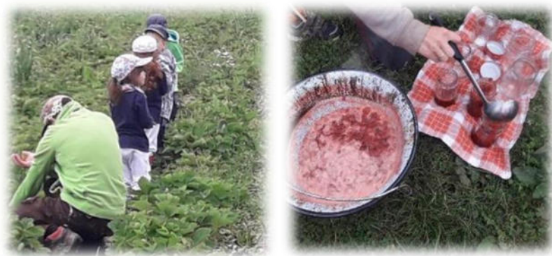
Abbildung 21: co.natur gGmbH Waldkindergarten Heimsheim

Arbeitsprozesse werden nach Möglichkeit in den Außenbereich verlagert, sodass ein ausgewogenes Verhältnis zwischen Tätigkeiten im Innen- und Außenbereich besteht. [...] Dieser Anspruch wird von den Waldkindergärten weitestgehend realisiert. Objekt- und kulturgebundene Innenraumtätigkeiten lernt das Waldkindergartenkind ohnehin in der verbleibenden Familienzeit kennen [...] Auf Lob wird weitestgehend verzichtet. [...]