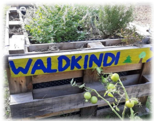
Abbildung 37: co.natur gGmbH Waldkindergarten Weil der Stadt

Die Kinder nutzen im Kindergartenalltag oft informelle Wege, um ihre Unzufriedenheit zu äußern. Sie äußern ihre Beschwerde nicht immer eindeutig und direkt. Dabei müssen sie sicher sein, dass ihre Anliegen ernst genommen werden. Auf die Festlegung einer "Beschwerdestelle" oder eines starren Verfahrens haben wir ganz bewusst verzichtet. Unsere Erfahrung ist, dass sich die Kinder in aller Regel an Mitarbeitende ihres Vertrauens wenden, wenn sie Anliegen haben und sich besprechen wollen. Diese selbstgewählte Person des Vertrauens steht den Kindern im Alltag unmittelbar zur Verfügung und ist sozusagen die erste, entscheidende Beschwerdestelle.