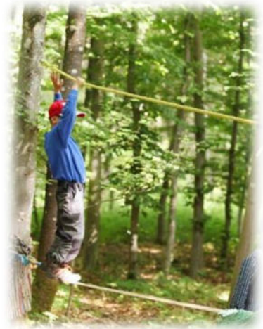
Abbildung 4: co.natur gGmbH Waldkindergarten Heimsheim

Ziel ist es, dass Kinder lernen, sich selbst einzuschätzen und sich etwas zuzutrauen. Die Kinder erfahren, dass sie durch eigene Anstrengung und Motivation Ziele erreichen können und entwickeln eine altersgemäße Frustrationstoleranz, wenn nicht gleich alles auf Anhieb gelingt. Sie lernen, sich zu konzentrieren und entwickeln Ausdauer. Die Kinder erleben Freude und Spaß.