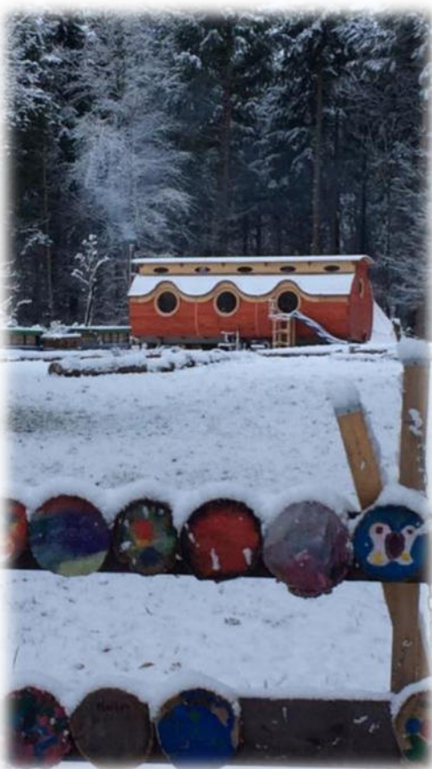
Abbildung 1: co.natur gGmbH Waldkindergarten Heimsheim

Die Wald- und Naturkindergärten haben ihren Ursprung im Jahr 1892 in Schweden. In Deutschland wurde 1968 der erste Waldkindergarten in Wiesbaden genehmigt. Der erste deutsche staatlich anerkannte Waldkindergarten wurde aber erst 25 Jahre später, 1993, in Flensburg eröffnet. Er wurde von Kerstin Jebesen und Petra Jäger gegründet. Sie hatten eine Zeit lang in Dänemark hospitiert, wo es viele Waldkindergärten gibt. Durch intensive Öffentlichkeitsarbeit und viele Besucher des Waldkindergartens in Flensburg wurde die Idee in ganz Deutschland weitergetragen.