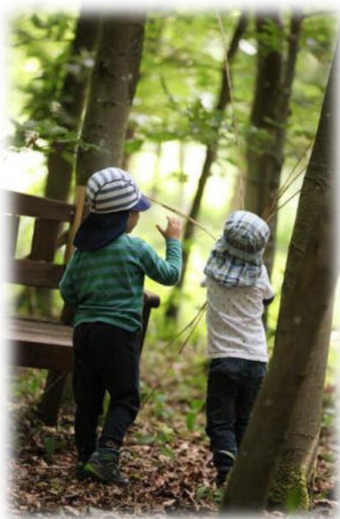
Abbildung 30: co.natur gGmbH Waldkindergarten Heimsheim

Eine tiefgehende Untersuchung zur vorschulischen Erziehung zeigt die Promotionsarbeit von Peter Häfner: