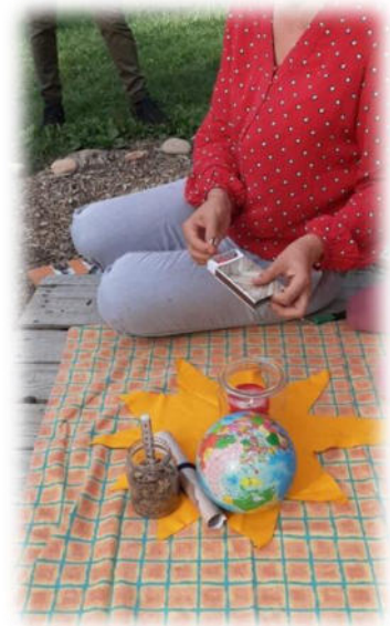
Abbildung 36: co.natur gGmbH Waldkindergarten Heimsheim

Unsere Mitarbeitenden nehmen aktiv Stellung gegen diskriminierendes, gewalttätiges und sexistisches Verhalten und greifen in solchen Fällen auch sofort ein. Wenn die Mitarbeitenden Kenntnis von einem Sachverhalt erhalten, der die Vermutung auf ein Fehlverhalten durch einen Mitarbeitenden nahelegt, wird dies umgehend dem unmittelbaren Vorgesetzten als auch der Geschäftsführung mitgeteilt. Das pädagogische Handeln unserer Mitarbeitenden ist transparent und nachvollziehbar und entspricht fachlichen Standards. Es werden vorhandene Strukturen und Abläufe eingehalten und dokumentiert. Dabei wird sich nach den Bedürfnissen der Kinder gerichtet und mit den Eltern bzw. Sorgeberechtigten kollegial und transparent zusammengearbeitet.