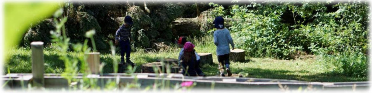
Abbildung 162: co.natur gGmbH Waldkindergarten Heimsheim