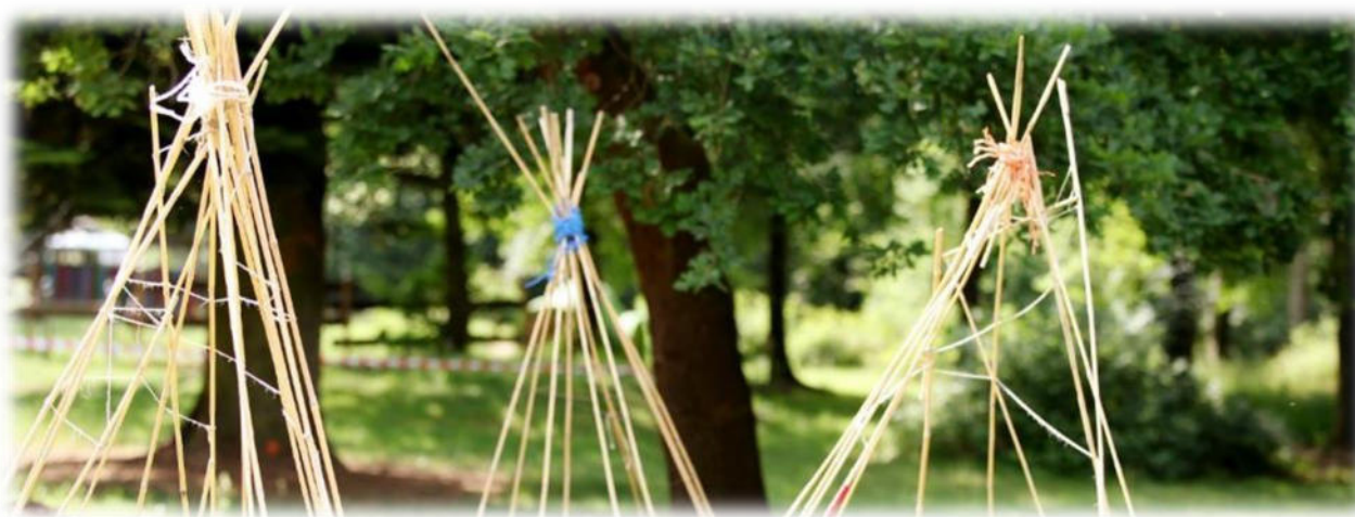
Abbildung 33: co.natur gGmbH Waldkindergarten Heimsheim

Eine vertrauensvolle und intensive Zusammenarbeit zwischen Eltern und pädagogischen Fachkräften ist eine wichtige Voraussetzung dafür, dass die ganzheitliche Förderung der kindlichen Persönlichkeit gelingt. Wir wollen, dass die Eltern ihre Kinder gut aufgehoben wissen und sich aktiv beteiligen. Wir legen Wert auf Mitarbeit und partnerschaftliches Miteinander sowie darauf, die Familie des Kindergartenkindes zu integrieren. Wir machen Veranstaltungen für die ganze Familie. Es gibt Geschwister-Besuchstage und Tage für ehemalige Kindergartenkinder, an denen diese zu Besuch kommen können, um liebgewonnene Erfahrungen und Aktivitäten aufzufrischen. Uns liegt die verlässliche Bindung zwischen Kindern und den pädagogischen Fachkräften sowie der partnerschaftliche Austausch mit den Eltern am Herzen.