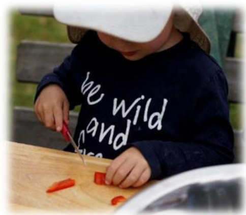
Abbildung 11: co.natur gGmbH Waldkindergarten Heimsheim

An den meisten Tagen ist Wilde Wichtel Gruppe im umliegenden Wald unterwegs und erkundet, spielt und lernt dort. Nötiges Material wird dabei im Bollerwagen transportiert.