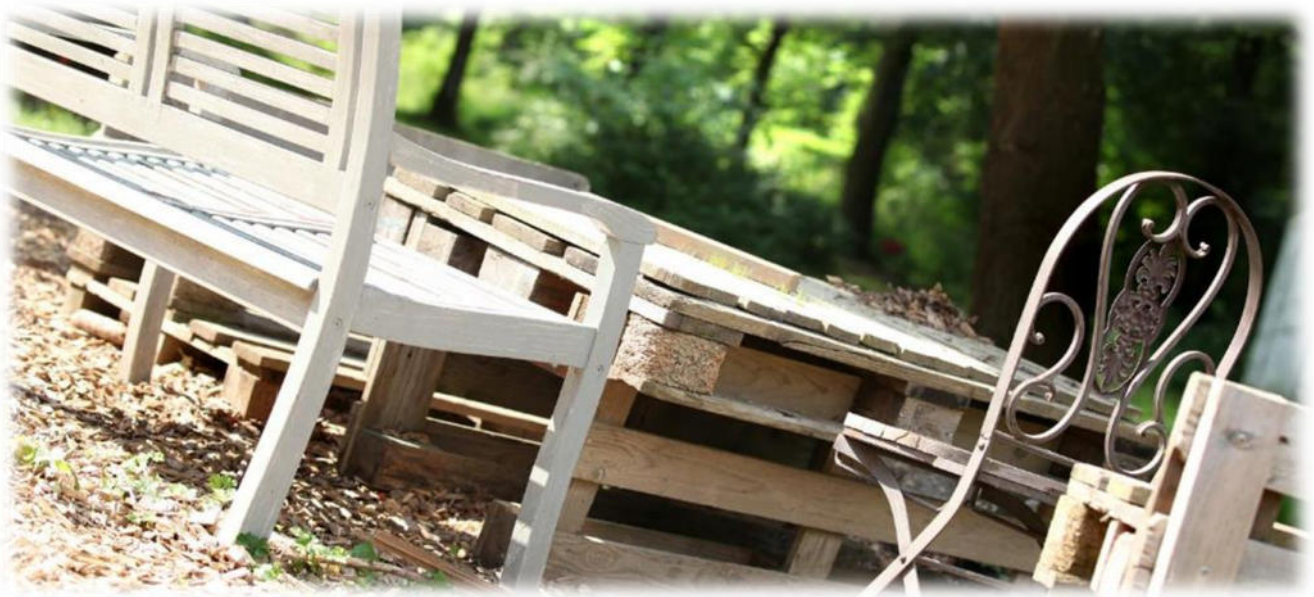
Abbildung 14: co.natur gGmbH Waldkindergarten Heimsheim

Die Teamsitzungen finden wöchentlich statt.