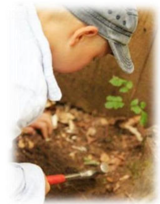
Abbildung 19: co.natur gGmbH Waldkindergarten Heimsheim