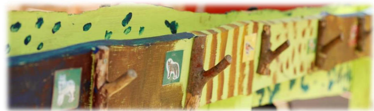
Abbildung 28: co.natur gGmbH Waldkindergarten Heimsheim

Die Eingewöhnung eines neuen Kindes erfolgt in Absprache mit den pädagogischen Fachkräften und ist individuell. Eine Fachkraft übernimmt die Eingewöhnung eines Kindes und geht eine vertrauensvolle Beziehung mit dem Kind ein. Nur ein Kind, das sich sicher und wohlfühlt, kann sich entspannt von den Eltern lösen und sich auf den Kindergarten freuen. Es braucht auch die Bereitschaft der Eltern, sich von ihrem Kind zu lösen, um ihm einen guten Start im Kindergarten zu ermöglichen. Daher legen wir bei der Eingewöhnung auch Wert darauf, dass die Eltern sich wohlfühlen.