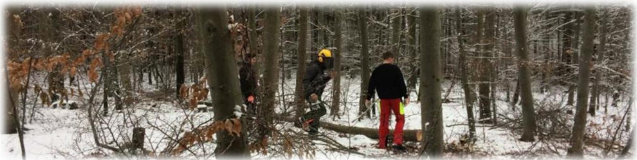
Abbildung 7: co.natur gGmbH Waldkindergarten Heimsheim

Zu den üblichen Gefahren gehören auch lose Äste in großer Höhe. Um sie zu entfernen, kommen regelmäßig Baumpfleger und überprüfen unsere Waldplätze, an denen wir uns vermehrt aufhalten. Es gibt eine erhöhte Verkehrssicherungspflicht in den Waldgebieten, die wir verstärkt nutzen und die markiert sind. Die Verkehrssicherung macht der Baumpfleger oder Baumpflegerin in Abstimmung mit den Forstbeschäftigten. Bei Forstarbeiten wird ein ausreichender Sicherheitsabstand eingehalten.