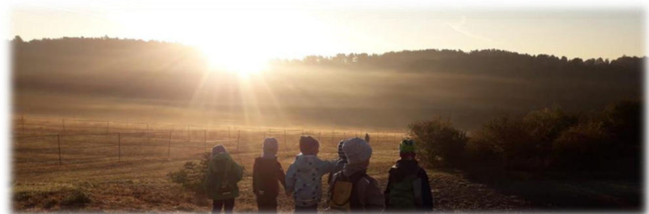
Abbildung 9: co.natur gGmbH Waldkindergarten Heimsheim