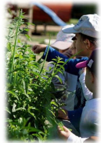
Abbildung 5: co.natur gGmbH Waldkindergarten Heimsheim

Deswegen ist es unerlässlich, dass Kinder wieder die Natur ganz elementar kennenlernen, weil es für den Fortbestand unserer Kultur wichtig ist, dass die Natur geachtet und geschützt wird. Nur wer die Natur in ihrer Einzigartigkeit kennen-gelernt hat, kann zu ihrer Erhaltung beitragen.